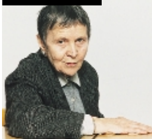
HÉLÈNE AHRWEILER Médiéviste, ancien recteur des universités de Paris