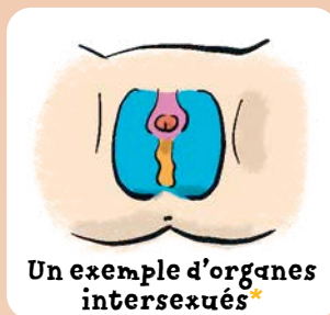
Un exemple d'organes intersexués*