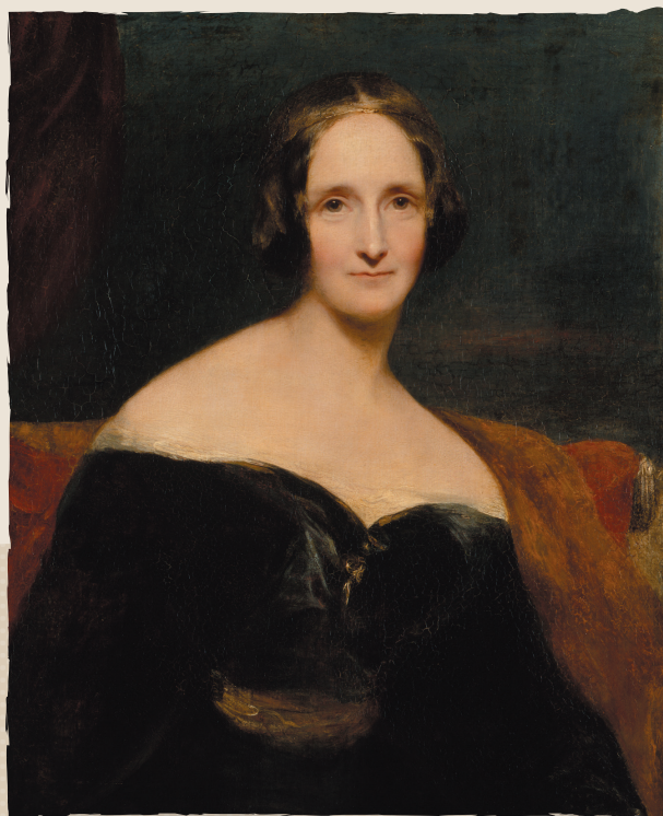
Portrait de Mary Shelley Toile de Richard Rothwell, 1840 →

Pour se mettre dans l'ambiance, ils lisent des récits de spectres et partagent leurs idées.