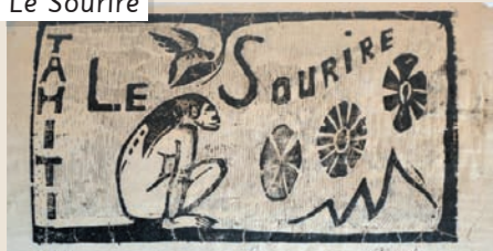
Gravure sur bois de Paul Gauguin