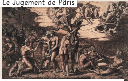
Gravure sur cuivre d'après Raphaël par Marcantonio Raimondi