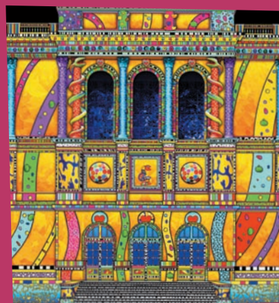
Spectaculaires, les allumeurs d'images