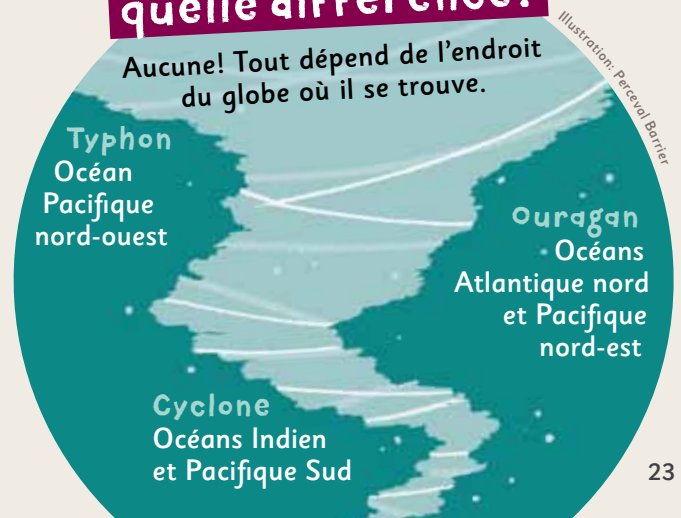
Illustration: Perceval Barrier