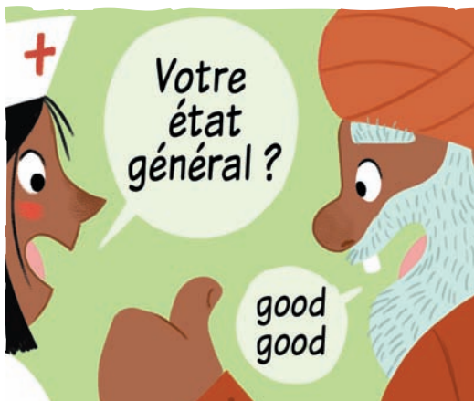
Illustration: Katia De Conti

En étudiant les réponses à cette question, le gouvernement pourra améliorer son système de soins.