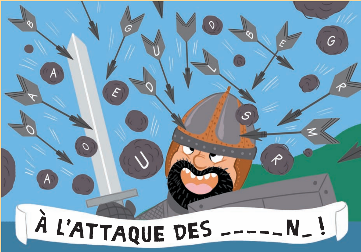
Illustration: Katia de Conti

Barre chaque projectile qui contient une lettre du mot «Burgonde». Il te restera alors 6 lettres pour former le mot caché. À toi de jouer!