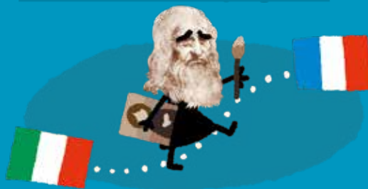
Portrait: Léonard de Vinci

Durant sa vie, de Vinci travaille à Florence, à Milan, à Rome.