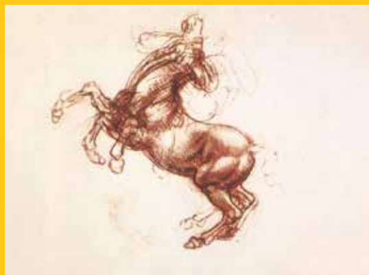
Illustration: Léonard de Vinci

Le peintre se passionne pour l'anatomie du corps humain. Il effectue même des dissections pour approfondir ses connaissances et améliorer ses dessins.