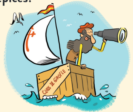
Illustration: Jérôme Sié

En 1494, les Espagnols et les Portugais se partagent le monde. Ils se disputent encore certaines régions comme les petites îles Moluques qui regorgent d'épices rares, en particulier le clou de girofle. Magellan veut conquérir ces îles et rapporter ces épices. Fâché avec le roi du Portugal, il propose son projet au roi d'Espagne, qui l'accepte.