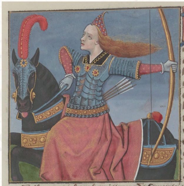
Boccace, Des cleres et nobles femmes , BnF, Français 599, f.27v

Par l'association des Jeunes Chercheurs Médiévistes de l'UNIGE En partenariat avec les associations Unil'AMHE et GAGSchola