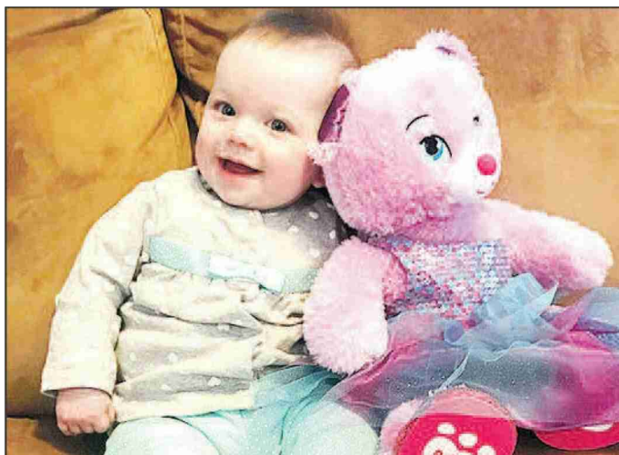
UNIGE. Au cours des six premiers mois, les bébés apprennent à reconnaître les expressions faciales.