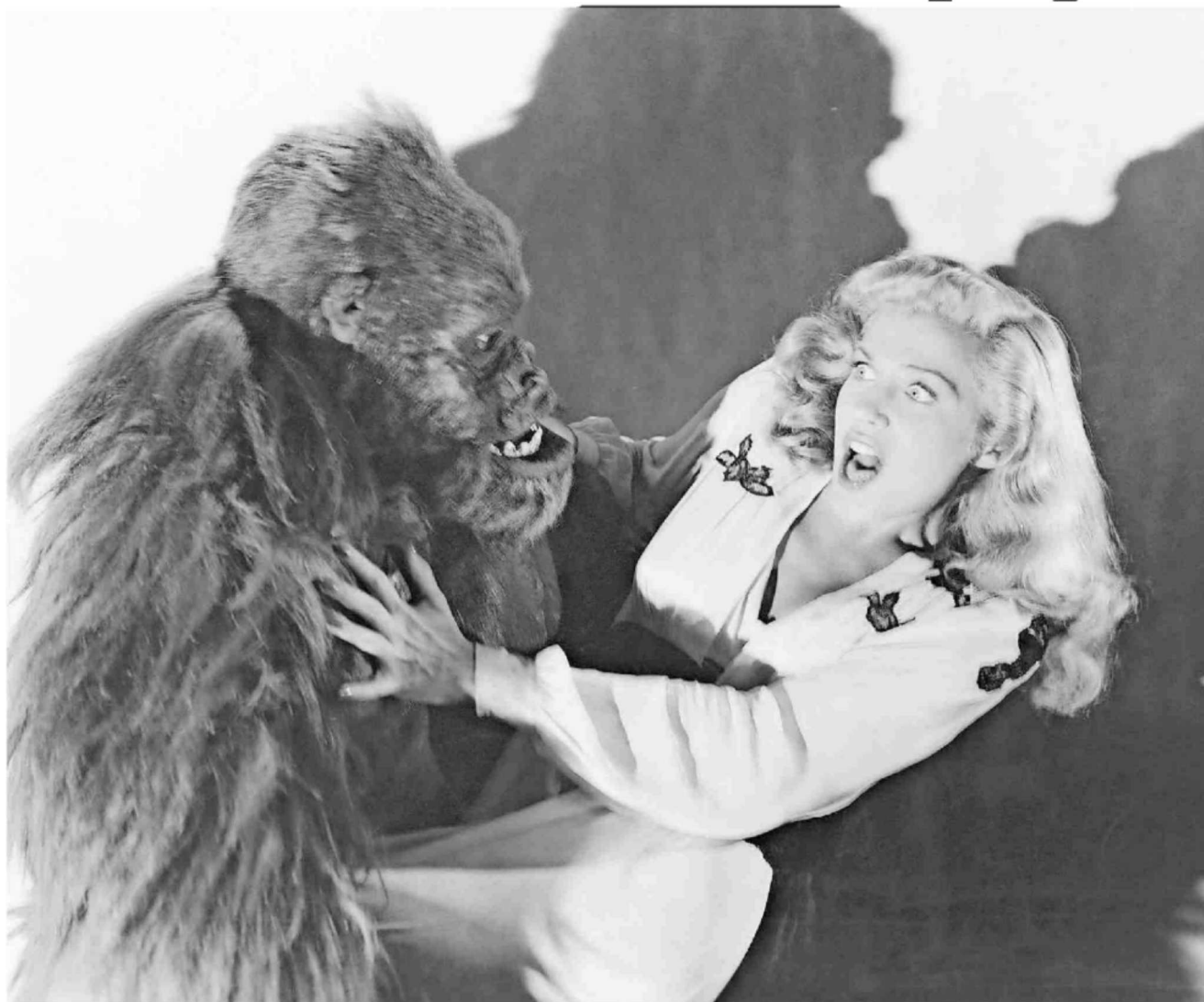
Les animaux comme les humains connaissent la peur, qui est une réaction normale.