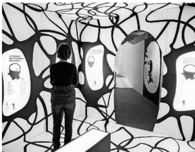
L'exposition met la peur en scène.