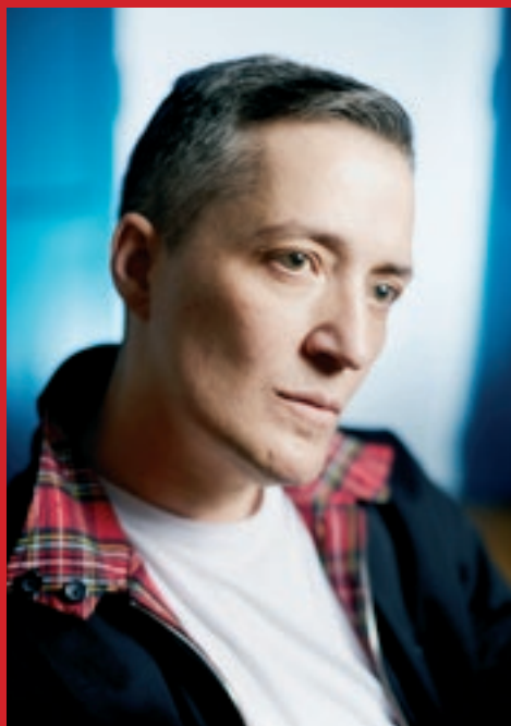
Paul B. Preciado