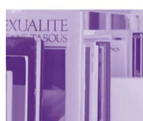
Rapport d'activités 2022

L'année 2022 a été pour le Centre Maurice Chalumeau en sciences des sexualités de l'Université de Genève (CMCSS), celle des mises en perspective. Par ses activités et ses réflexions, le Centre a précisé et affiné ses périmètres d'activité et ses missions. Ce travail a été accompli dans la continuité de ses deux années d'existence : 2020, l'année de la création de ce centre interdisciplinaire unique en son genre dans le contexte européen ; 2021, l'année des fondements, où le CMCSS a posé ses bases et développé sa structure.