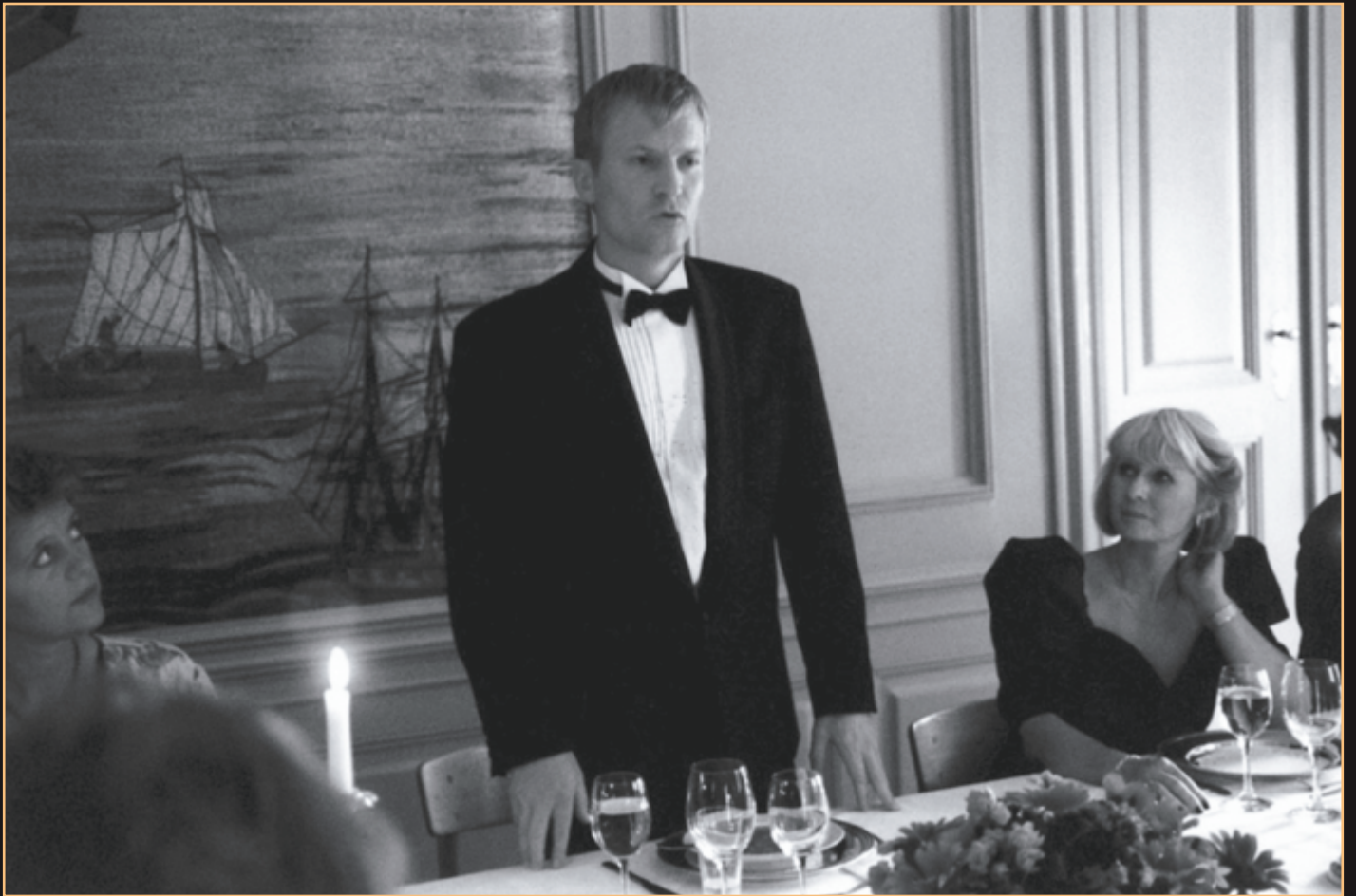
Festen (1998) de Thomas Vinterberg est le premier film réalisé selon les règles du mouvement Dogme95.