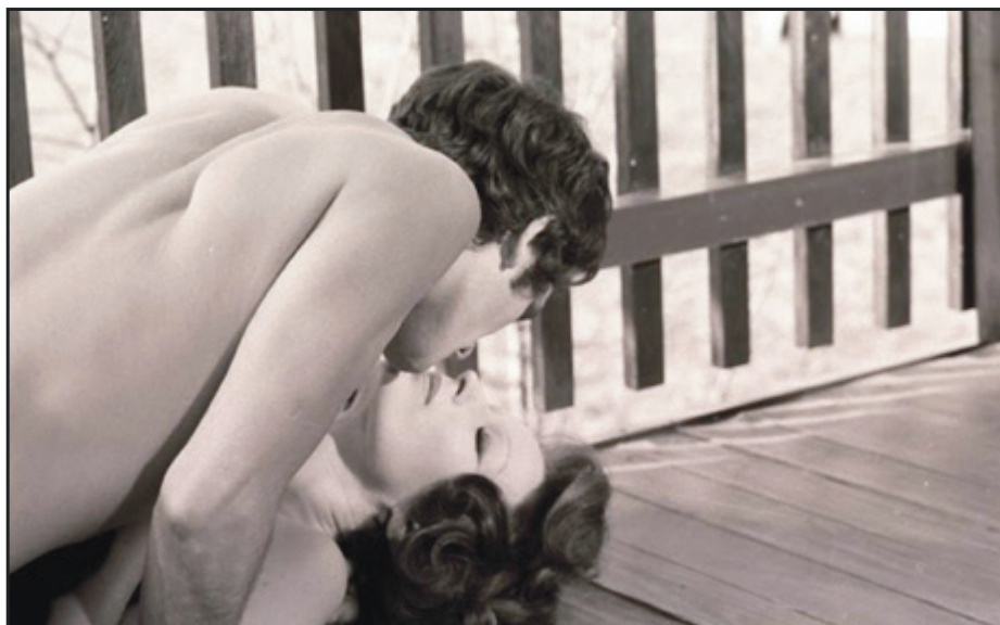
Silvana Mangano dans Teorema (1968) de Pier Paolo Pasolini.

parfaite continuité avec l'œuvre des quatre années précédentes. Le succès public limité du film et la rupture avec Gorin conduisent bientôt à la fin d'une des expérimentations du cinéma antibourgeois les plus complexes de tous les temps.