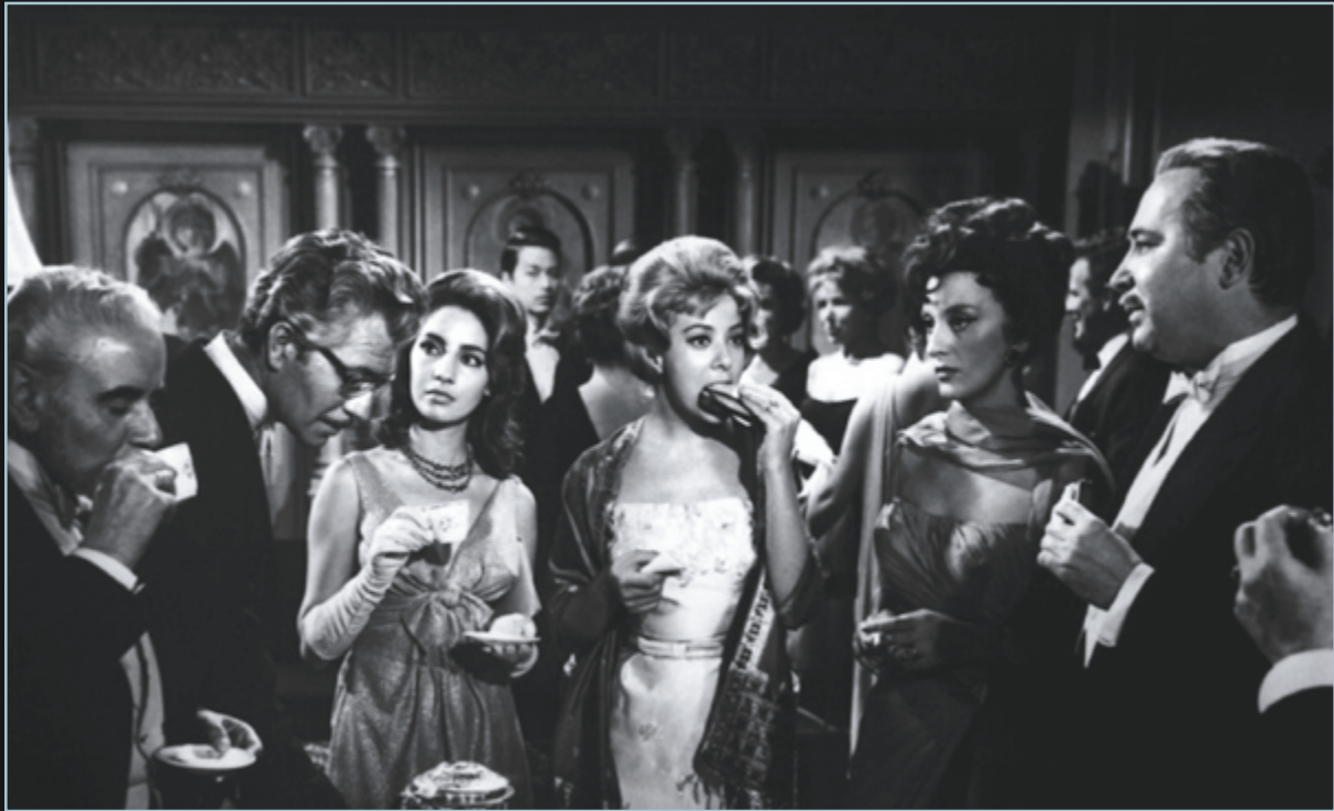
El ángel exterminador, Luis Buñuel, 1962.