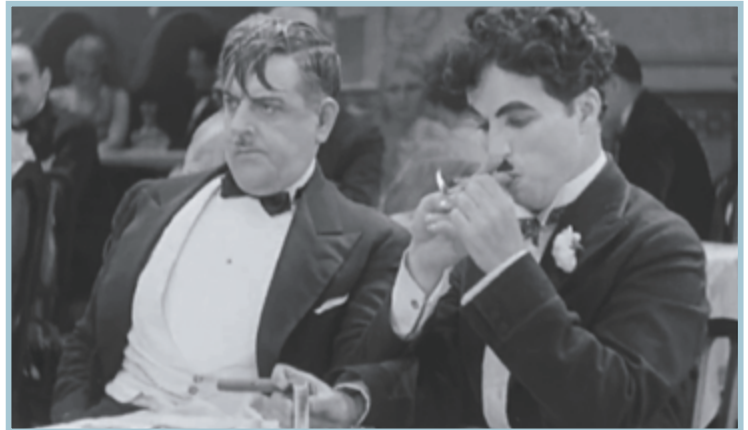
Dans City Lights (1931) de Charles S. Chaplin, un vagabond aux marges de la société n'arrive à entrer en rapport avec un millionnaire que lorsque ce dernier est ivre.

historico-politique contingente. Par exemple, dans une œuvre de critique sociale très célèbre telle que Les misérables (1862) de Victor Hugo, le parcours semé d'embûches et de rédemption du protagoniste Jean Valjean, la cruauté endémique de Javert ou de Thénardier, les faits historiques spécifiques tels que la bataille de Waterloo ou les barricades de Paris en 1832, revêtent beaucoup plus d'importance que les facteurs intrinsèques, à la fois sociaux et économiques, qui, tout en étant présents, sont rarement analysés en tant que facteurs clés du destin des personnages. Même au sein d'une littérature profondément influencée par le réalisme, ce genre d'œuvres ne s'éloigne pas de la vision du monde des tragiques de l'époque classique, avec leur bagage de topoï et expédients narratifs tels que le deus ex machina et un univers de personnages sculptés dans l'éternité, dont l'universalité permet souvent d'éviter une comparaison plus directe et serrée avec les éléments distinctifs de l'époque historique de référence. Des discours semblables peuvent être énoncés à l'égard d'autres grands écrivains réalistes du 19 e siècle, tels que Dickens, Balzac ou Dostoïevski.