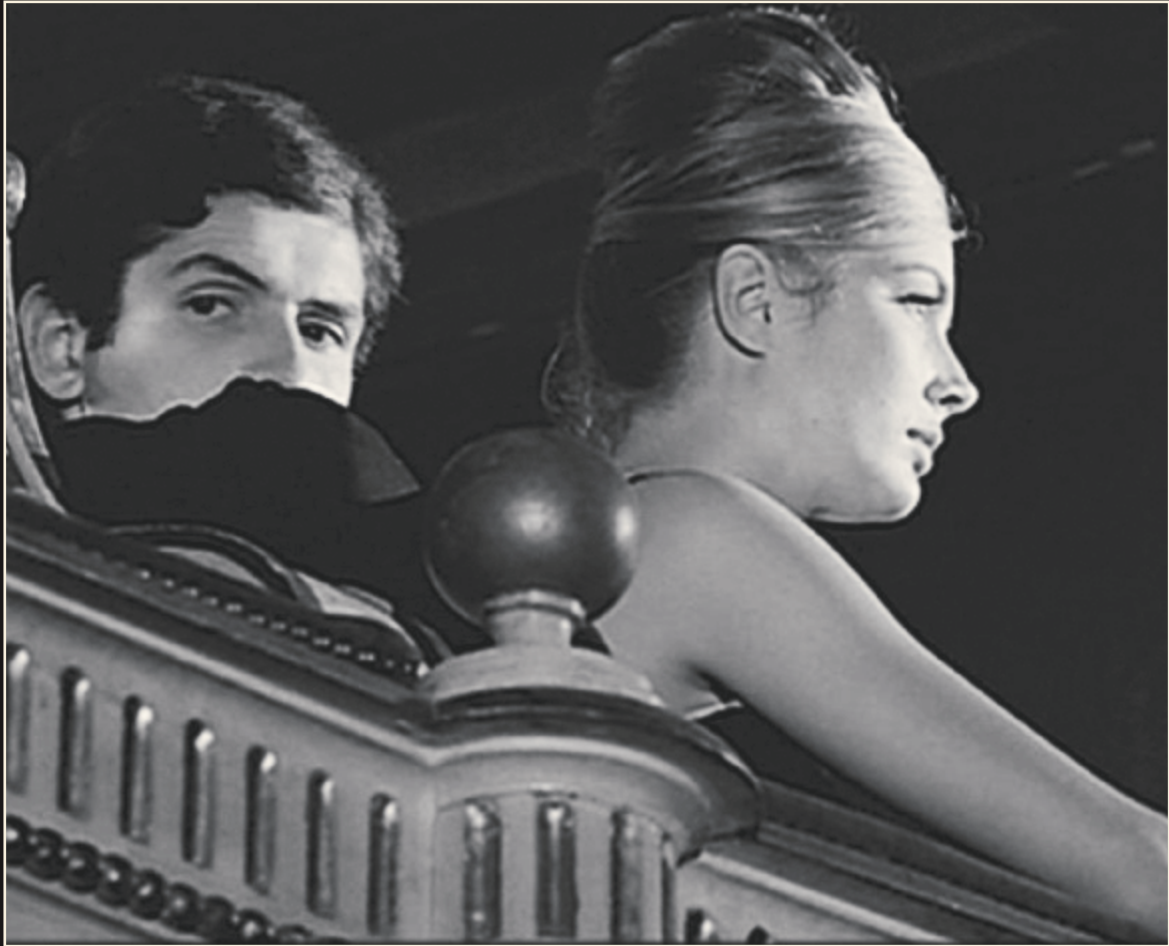
Prima della rivoluzione, Bernardo Bertolucci, 1964.