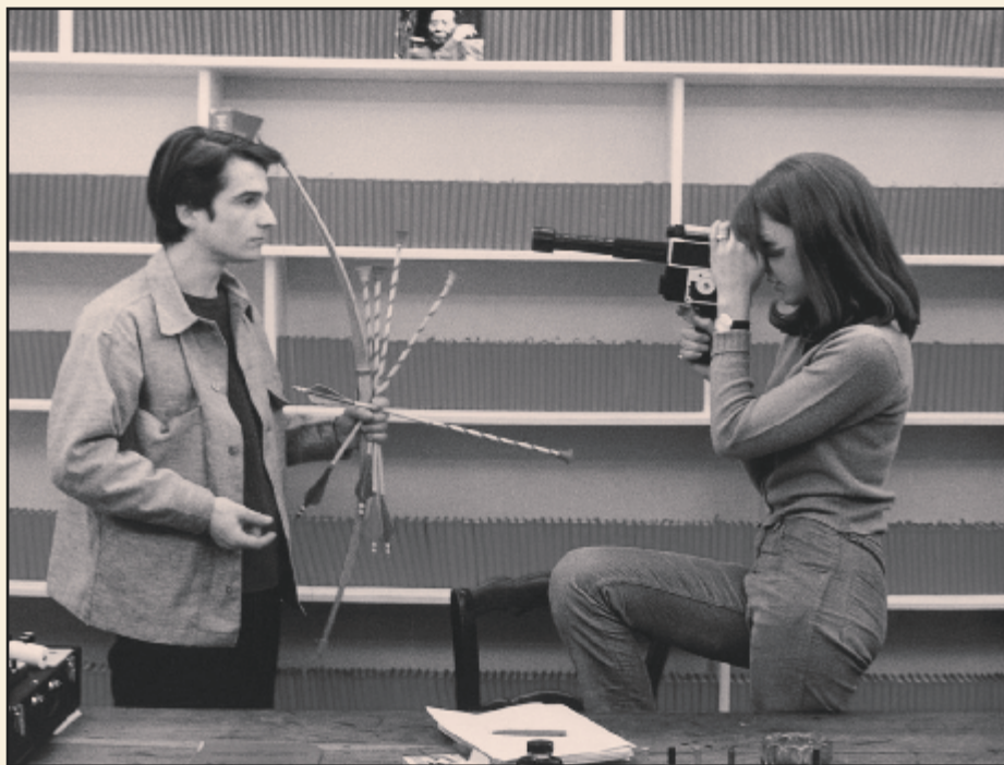
Jean-Pierre Léaud et Anne Wiazemsky dans une scène de La Chinoise (1967) de Jean-Luc Godard.

dédiée à un des phénomènes les plus représentatifs de l'époque: l'adhésion croissante de beaucoup de jeunes gauchistes à la doctrine du président du parti communiste chinois, Mao Zedong, en opposition à la traditionnelle ligne communiste philosoviétique (le Petit livre rouge , qui contient la pensée de Mao, est également un best-seller: au début de 1967, il est le deuxième livre le plus vendu en France). Avec un budget très mince, comme d'habitude, Godard situe la presque totalité de son film dans un appartement parisien, en gagnant le pari d'en faire un laboratoire pour une analyse scientifique, in vitro , des grands changements géopolitiques et sociaux survenant dans le monde. La Chinoise finit par se faire à la fois l'hymne romantique à une jeunesse concernée par le