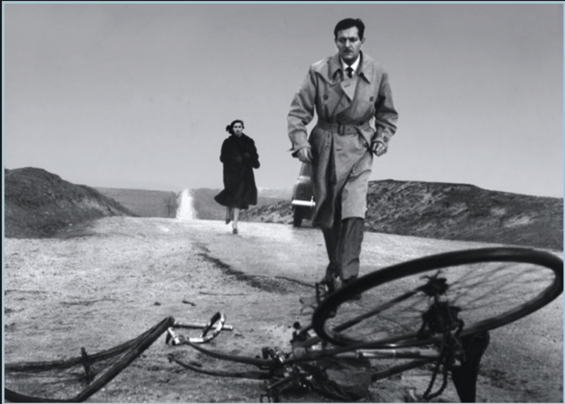
Muerte de un ciclista, Juan Antonio Bardem, 1955.