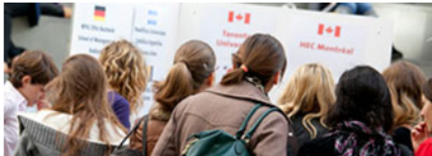
Site internet de la Mobilité à la Faculté de droit