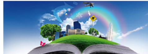
Site internet de la Mobilité universitaire