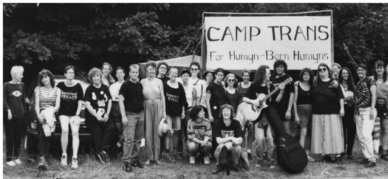
Camp Trans activists across from Michigan Womyn’s Music Festival, when transgender folks were barred from attending in 1994

Intervenante: Élise ESCALLE, doctorante en philosophie de la musique à l'université Paris Nanterre et chercheuse invitée à l'Institut des études genre