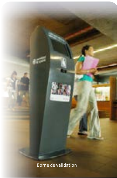
Borne de validation