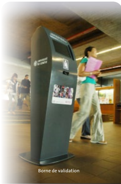
Borne de validation