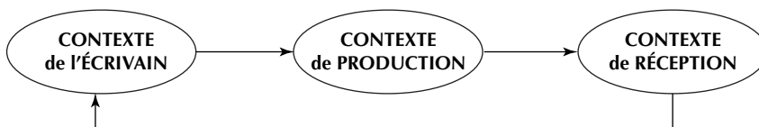
Figure 2 : Incidence du destinataire sur le texte (Milian, 1994)

La recherche est conçue, dans un premier temps, autour des éléments suivants : (a) l'objet de la recherche est déterminé par trois situations d'écriture différentes dans le contexte de la salle de classe ; (b) les instruments de médiation naissent de l'organisation de l'activité d'écriture en groupe, qui permet et favorise l'interaction verbale entre les participants et dont l'enregistrement constituera le corpus de données pour l'analyse ; (c) la direction de l'activité apparaît dans l'intention d'observer la représentation – ou projection – du contexte de réception à partir du contexte de production. Celui-ci est conçu également comme espace de confluence de l'expérience de la personne qui écrit, acquise dans des situations d'usage social de l'écrit. La figure 2 indique, de façon schématique, l'interrelation entre les contextes en jeu dans la situation de composition écrite.