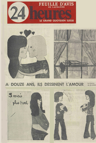
24 Heures, 06-07.01.1973