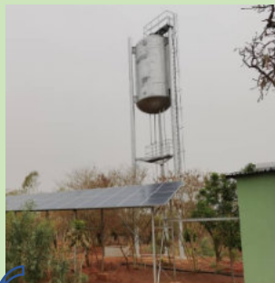
Retenue d'Eau potable

Kima Roland Windébé Master AISE / FPSE UNIGE rolandwindebekima@gmail.com