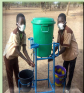
Hygiène et assainissement