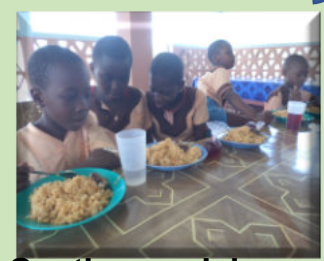
Cantine scolaire autonome

L'avenir de notre planète, passe par une éducation au développement durable avec nos enfants, et par nos enfants, nos décideurs de demain.