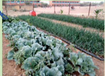
Jardin potager scolaire