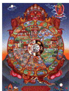
La Roue de la Vie

Développement social et affectif au cours de la vie (DEVEMO)