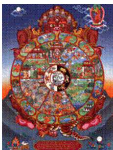
La Roue de la Vie

Développement social et affectif au cours de la vie (DEVEMO)