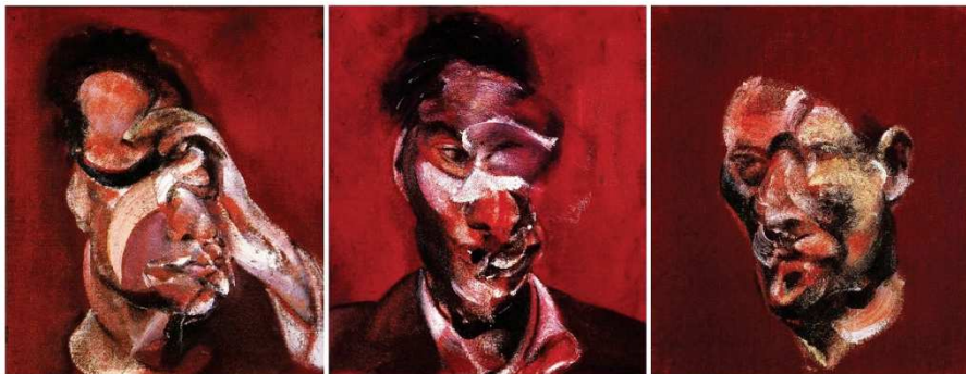
F. Bacon, 1969, Three Studies of Lucian Freud