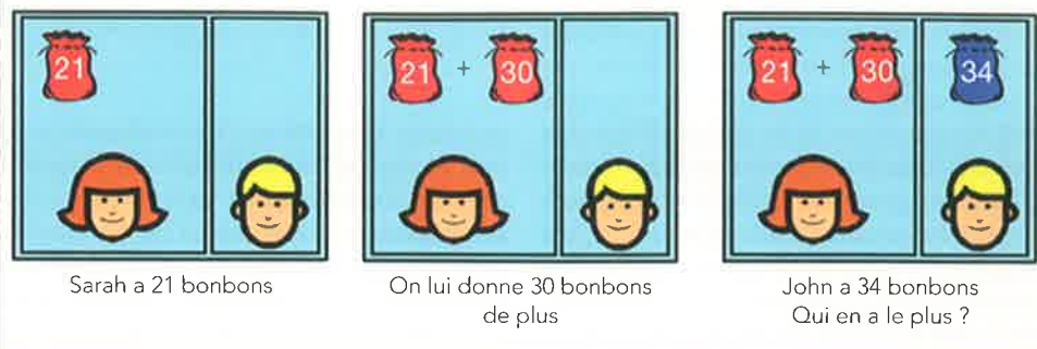
Figure 2 Illustration d'un problème d'addition proposé aux enfants de cinq ans dans l'expérience de Gilmore, McCarthy et Spelke [9]

fants étaient meilleures lorsque les deux nombres à comparer étaient éloignés que lorsqu'ils étaient proches, les auteurs en ont déduit qu'ils avaient réussi à résoudre ces problèmes en convertissant les nombres présentés en quantités approximatives. Les enfants, dès cinq ans, seraient donc capables de construire une manière de résoudre des problèmes symboliques en utilisant leur système approximatif du nombre. Cette étude met bien en évidence les bénéfices apportés par le recours de ces enfants à leur sens des nombres. Encourager les enfants, même plus grands, à s'appuyer sur leur intuition numérique, par exemple pour estimer le résultat attendu d'un calcul, ne peut être que bénéfique pour garder le sens parfois oublié des quantités derrière les symboles.