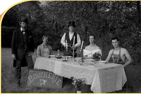
2017. Paroles et musique: Jacko & the Waschmachine