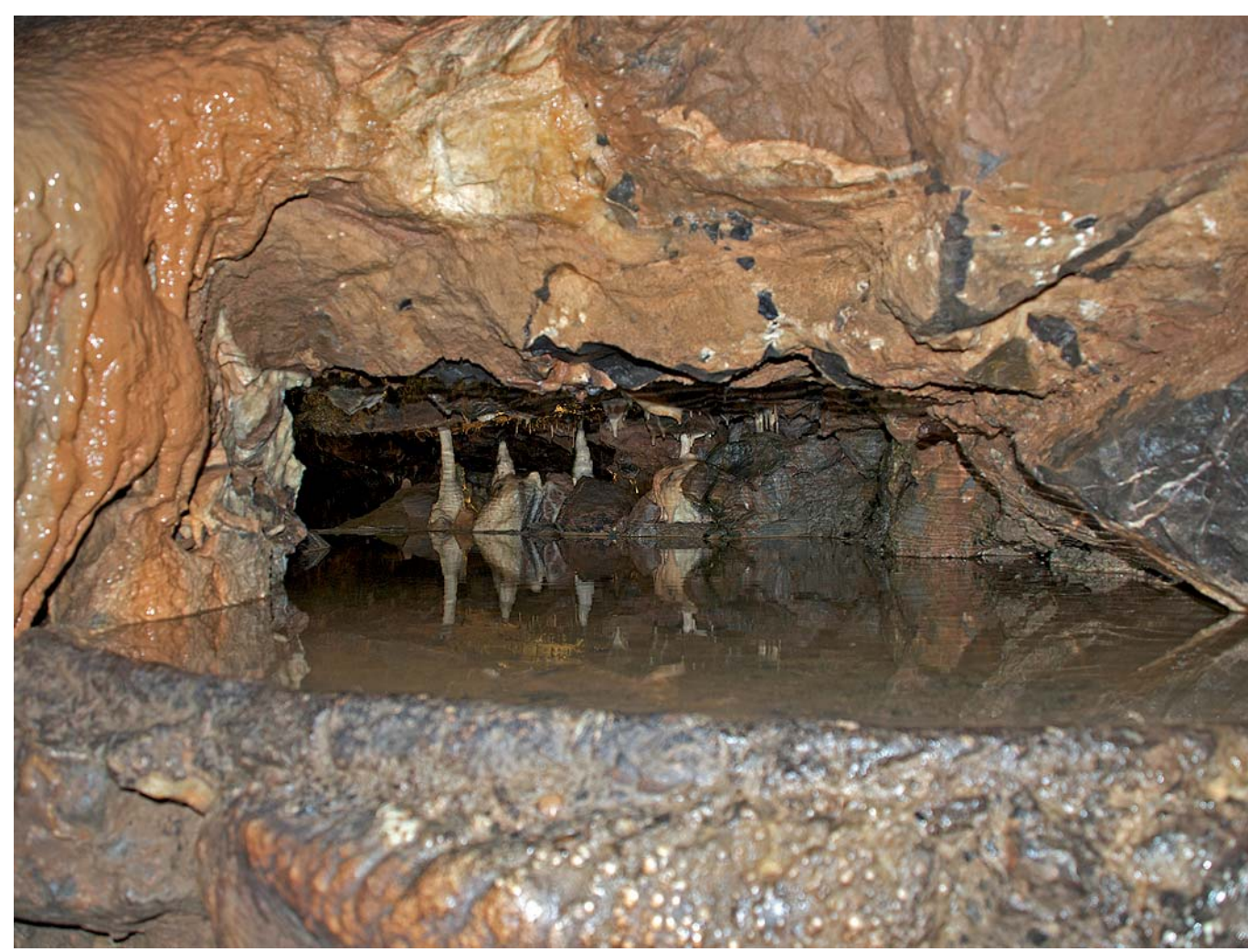
Plus de 7'000 objets ont été retrouvés dans les Cheddar's Gorge (Somerset). Petit plus : venez, visitez et mangez un peu de ce « great cheese » !!!