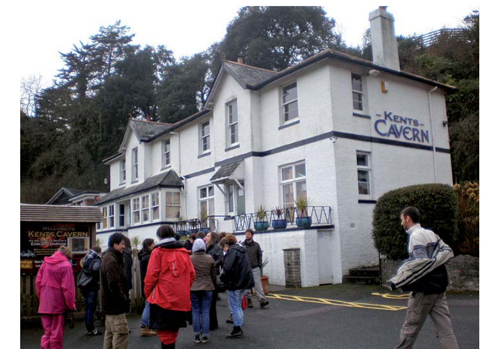
La Kents Cavern (Devon) est considérée comme la plus ancienne habitation humaine d'Angleterre. Lors de la visite guidée d'une grotte tourne au théâtre «TO BE OR NOT TO BE »...