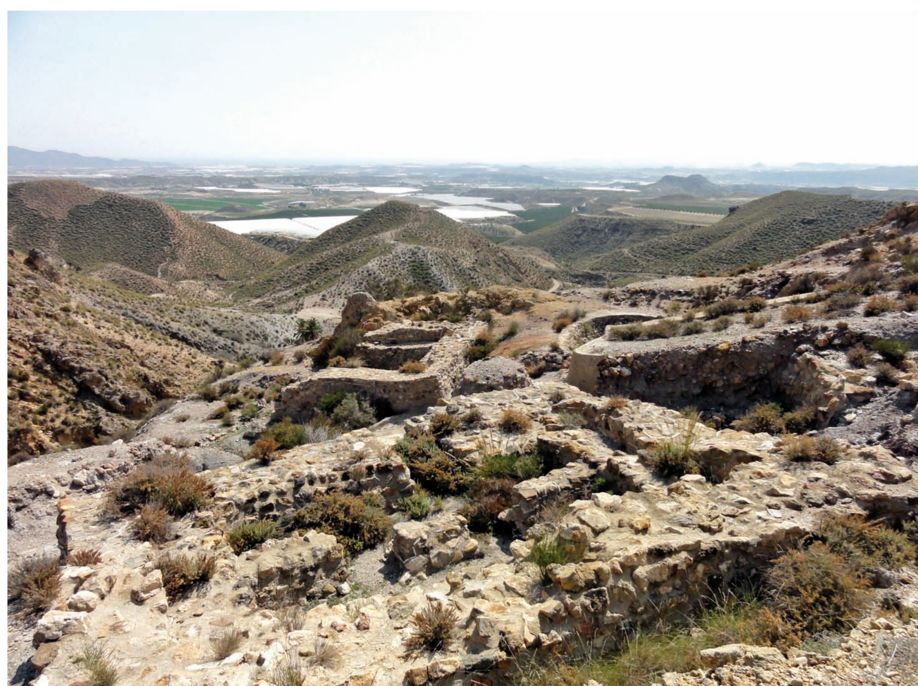
Le site fortifié de Fuente Alamo (Cuevas del Almanzora), occupé de façon ininterrompue à l'âge du Bronze, est situé de manière à surveiller l'ensemble de la vallée.