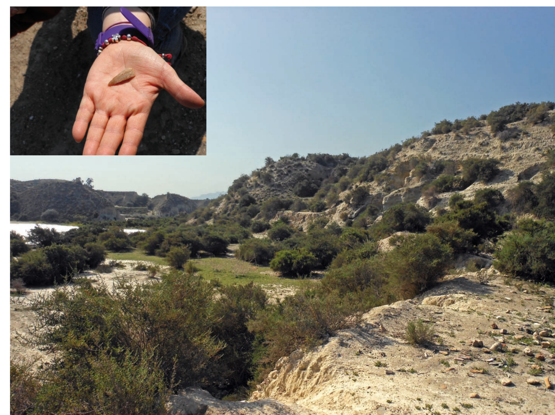
Cette pointe de silex a été trouvée dans la zone archéologique d'El Argar et de La Gerundia (Antas), occupée entre le Néolithique et l'âge du Bronze.