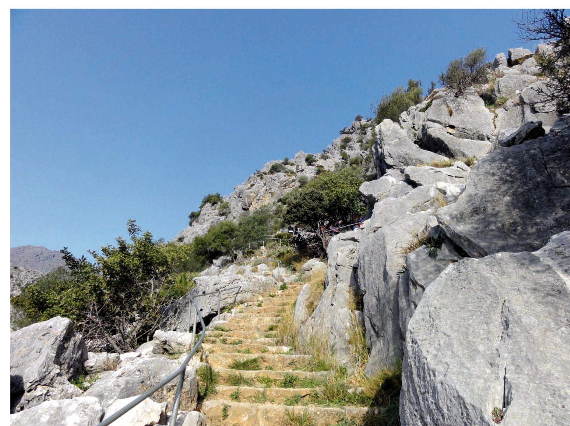
L'accès à la grotte de la Pileta (Benaolan) se fait par un long escalier en pierre. La grotte doit sa renommée non seulement aux fabuleuses peintures paléolithiques, mais aussi à la découverte de la Vénus de Benaolan.