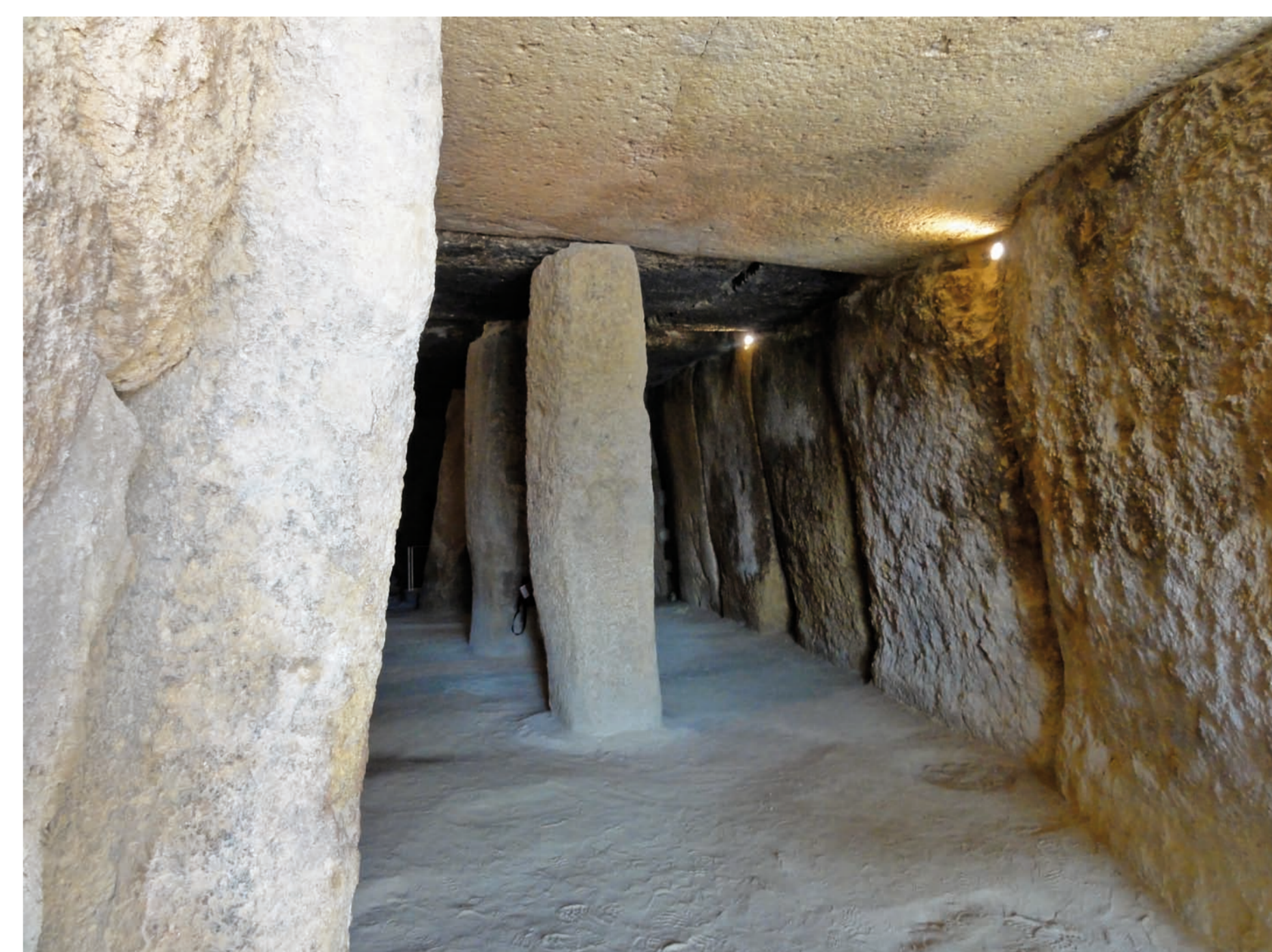
Une petite balade dans l'ancre du dolmen de Menga (Malaga) nous a permis de prendre la mesure de cette construction monumentale, de son exécution grâce à la force de l'homme mais aussi de son ingéniosité.