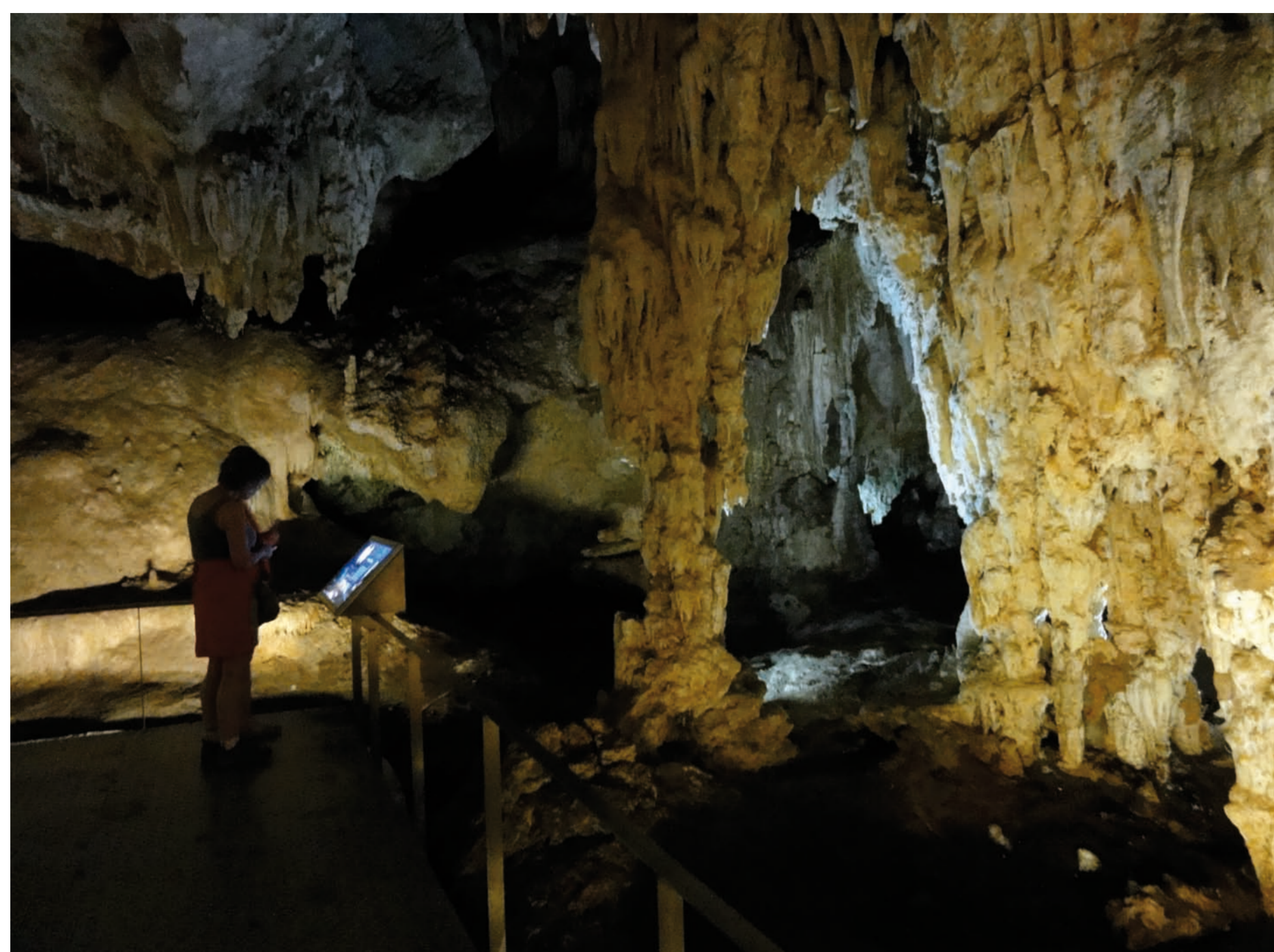
La Cueva de Nerja (Malaga) est une grotte comptant plus de 4'823 m de couloir. Elle a été occupée dès le Paléolithique supérieur et pendant le Néolithique. Elle abrite un grand nombre d'inhumations préhistoriques.