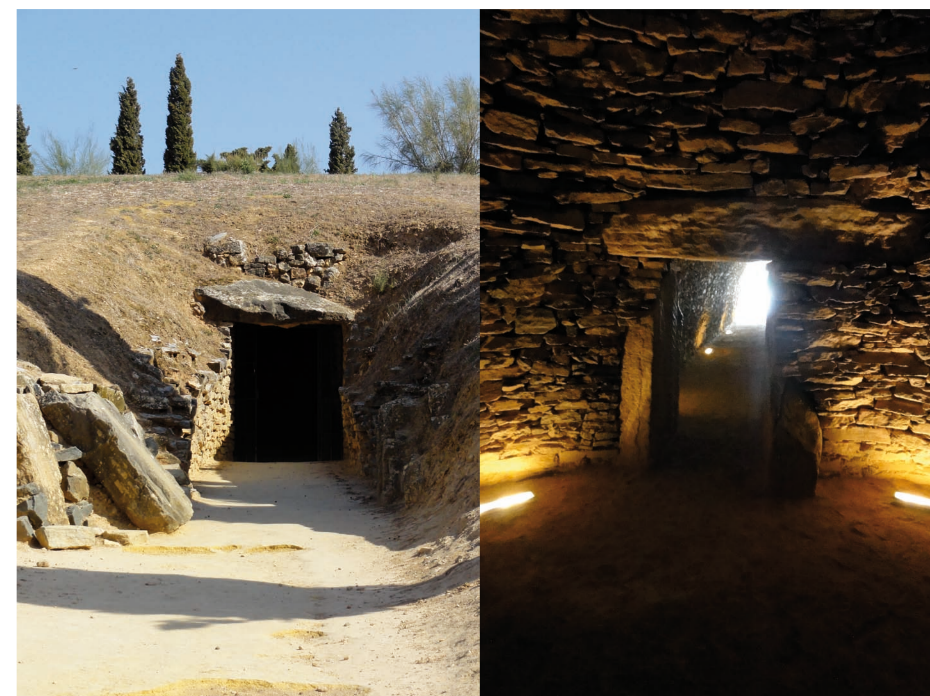
Un petit détour par la grande chambre du Tholos de El Romeral (Malaga) qui présente une voûte en "fausse coupole". Un endroit empreint de sérénité, idéal pour une dernière demeure...