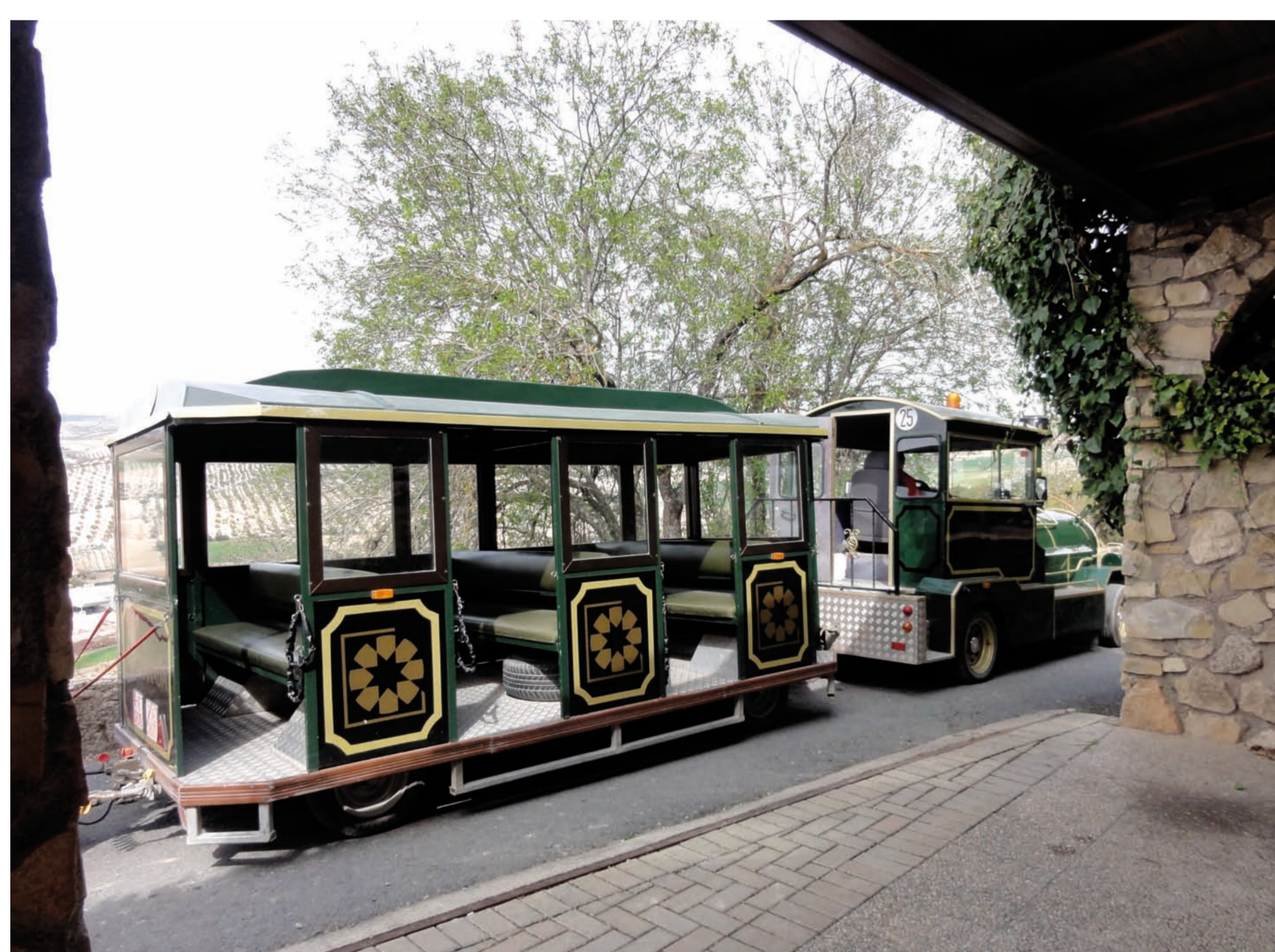
La Cueva de la Ventanas (Piñar) est un site occupé du Paléolithique au Mésolithique, dont il subsiste quelques restes de sépultures et de peintures rupestres. On rejoint la grotte à l'aide du «pequeño tren verde»...