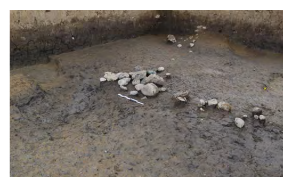
Diverses structures : foyer en cuvette avec remplissage de pierres, foyer simple à plat, vaste structure de combustion (plan et profil), petit empierrément.