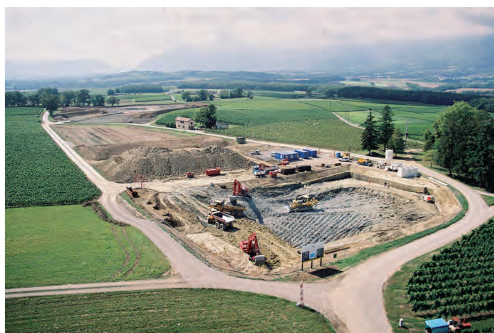
Vue générale de la zone affectée par les travaux pour le réservoir construit par les SIG, 2005.