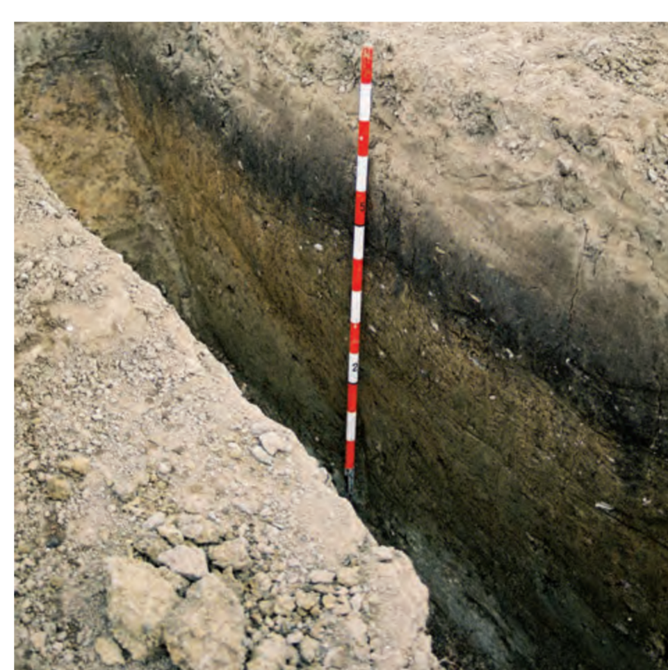
Un profil stratigraphique