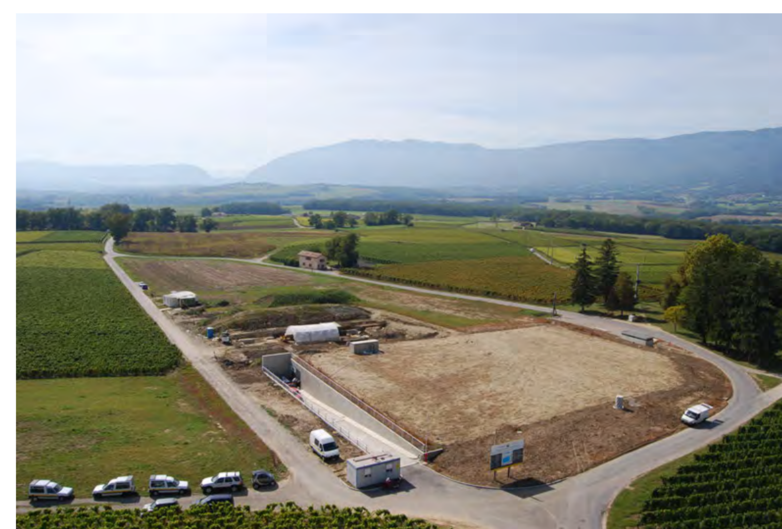
Fin des travaux du réservoir, zone de fouille amont, 2007.

Le site de Créderly, entre les villages de Peissy et Chouilly, sur la commune de Satigny (GE) est l'un des points les plus hauts du canton (environ 488-502 m d'altitude). Offrant une bonne vue sur la campagne environnante et bénéficiant de la présence de puits artésiens en sus de la proximité de deux cours d'eau – le Rhône et l'Allondon – l'endroit se prête à une fréquentation humaine précoce.