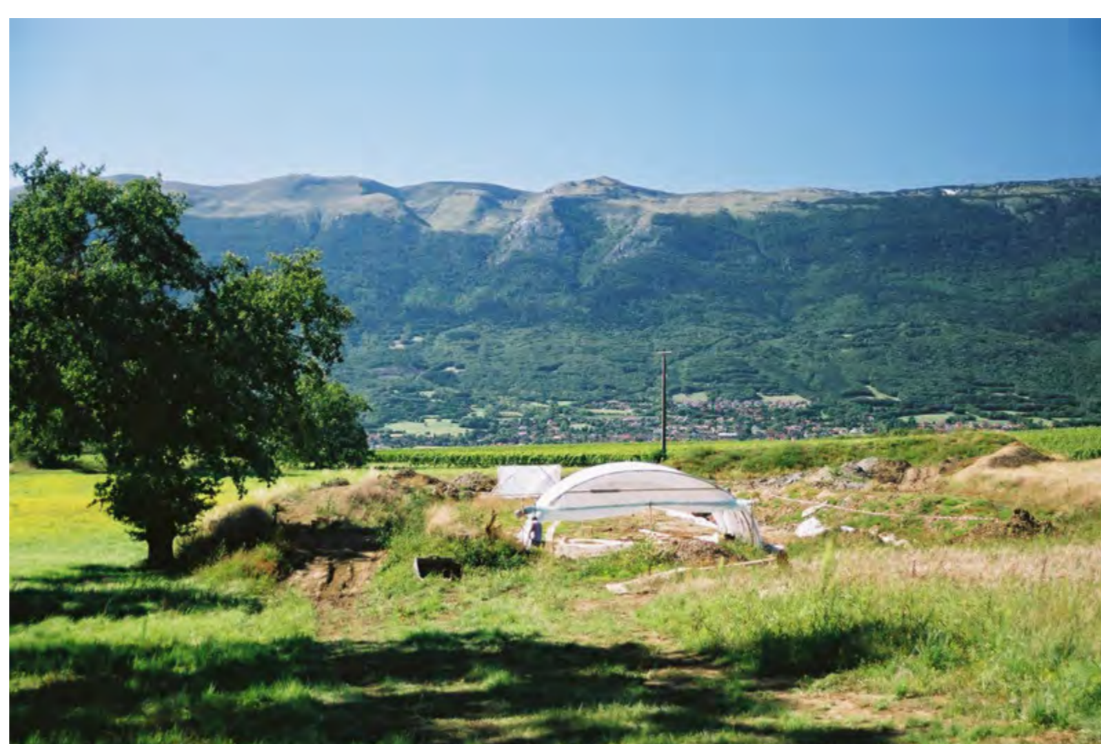
Fouille de la zone aval, août 2006.