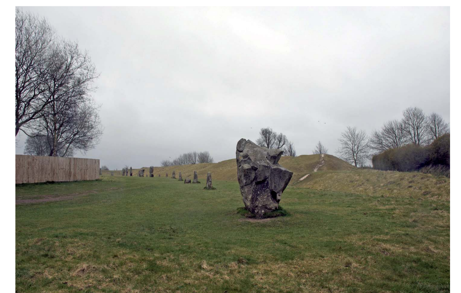
Avebury (Wiltshire) est le plus vaste henge connu actuellement, englobant le village du même nom