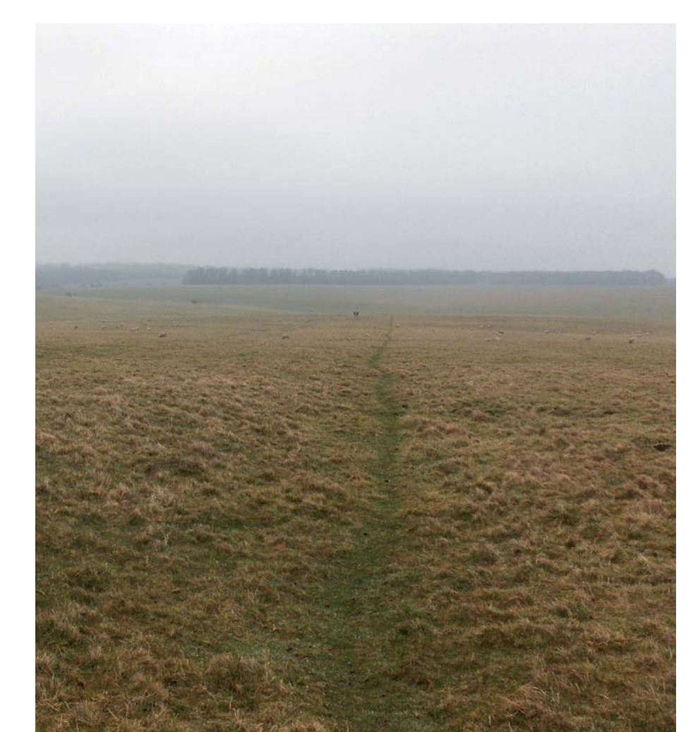
The Avenue (Wiltshire), la voie entre Stonehenge et Bluestonehenge