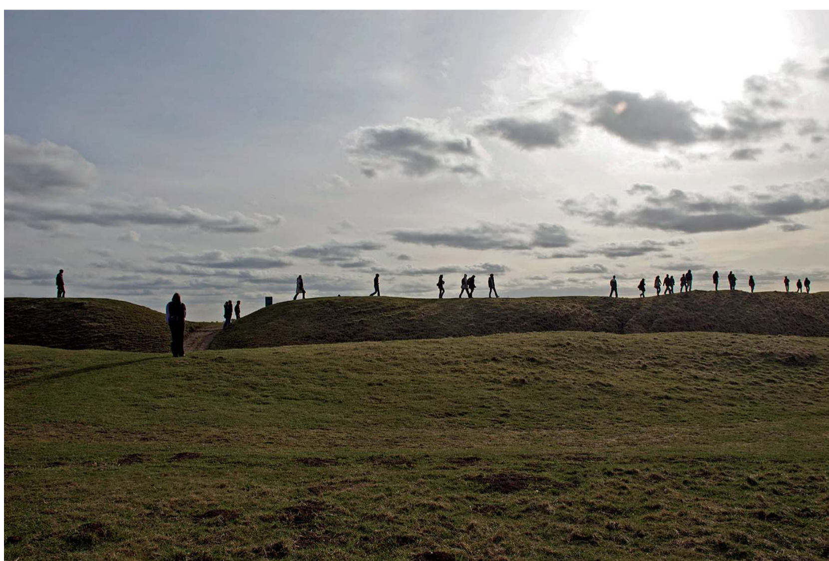
Une balade en fin de journée sur le site fortifié de hauteur d'Uffington Castle (Oxfordshire) datant de l'âge du Fer...