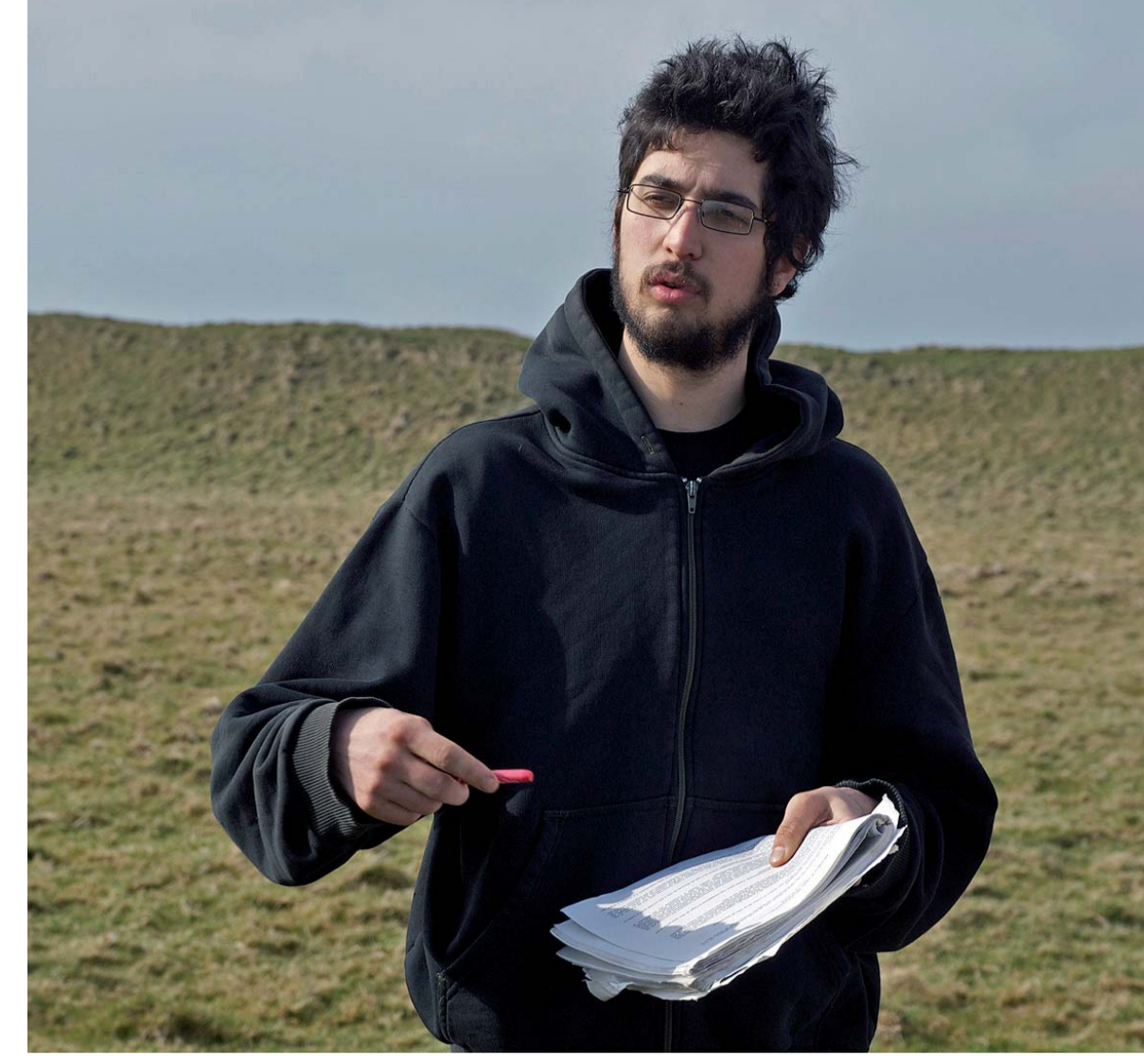
Selon les lectures de Renaud, le site de Wayland's Smithy est le plus « atmosphérique » des gisements britanniques