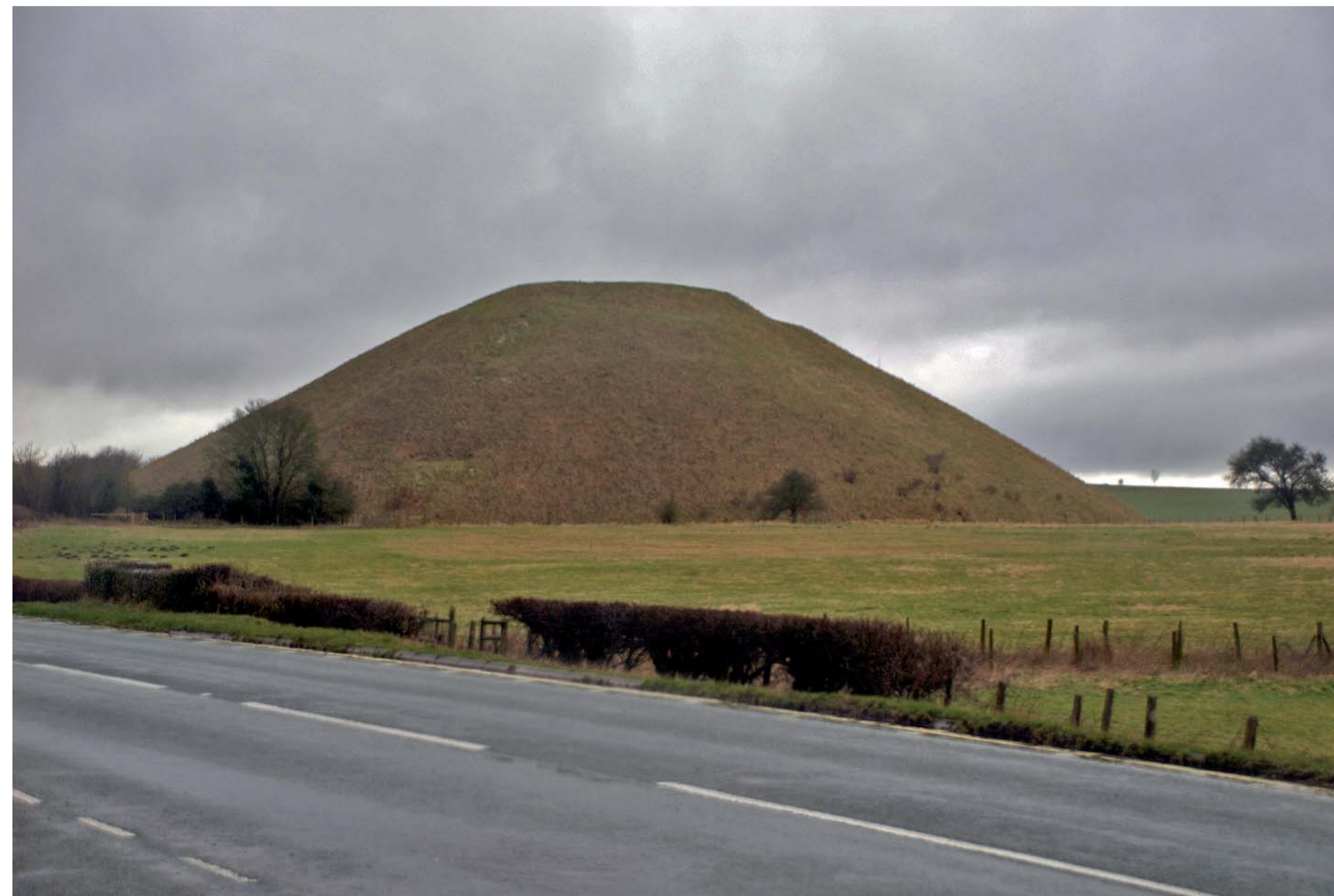
Le tumulus de Silbury Hill (Wiltshire) est à l'heure actuelle le plus grand tumulus jamais construit pendant la préhistoire. Il a une hauteur de 40 m et couvre une aire de 2 ha