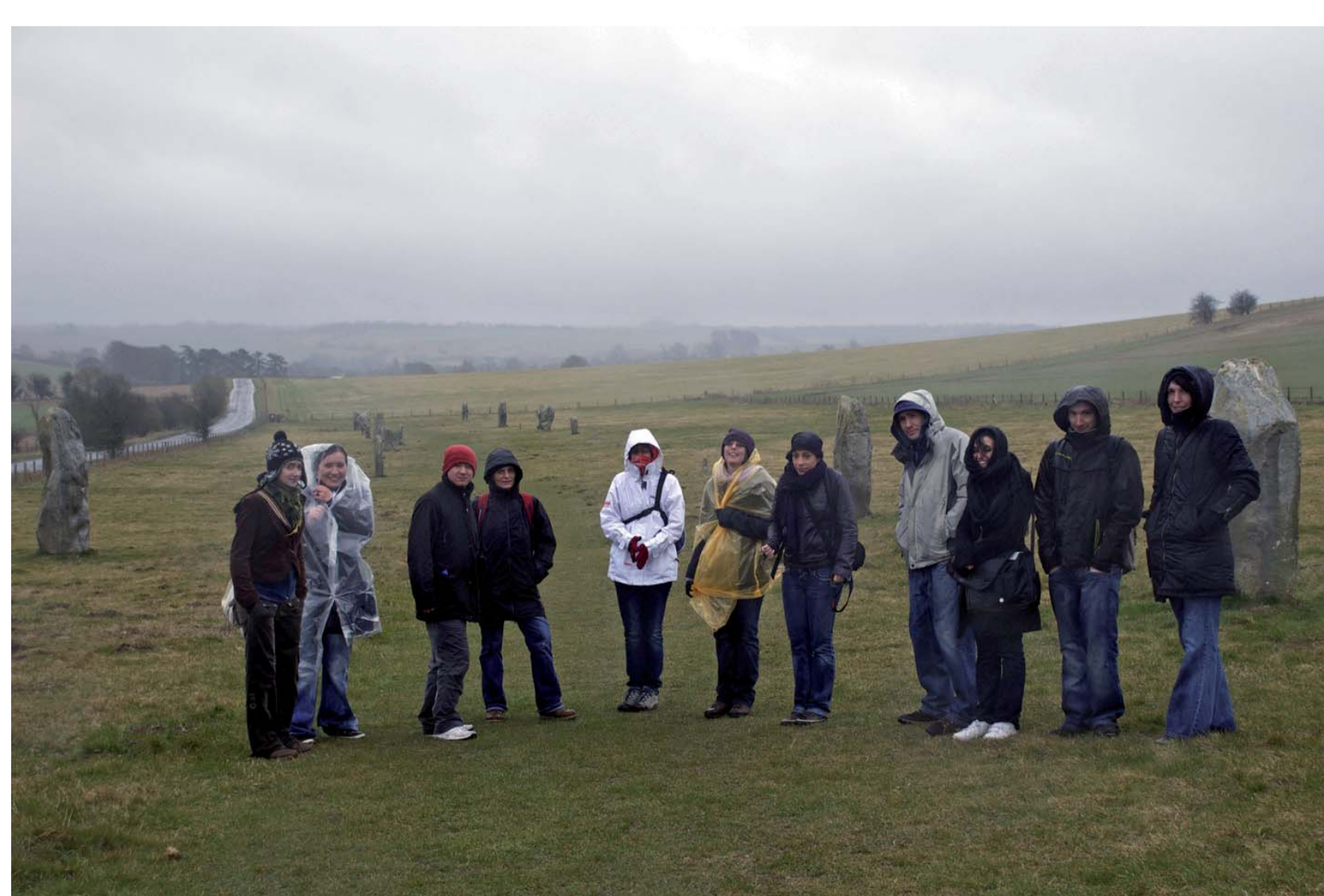
The Longstones (Wiltshire) sont deux blocs erratiques en grès nommés Adam et Eve