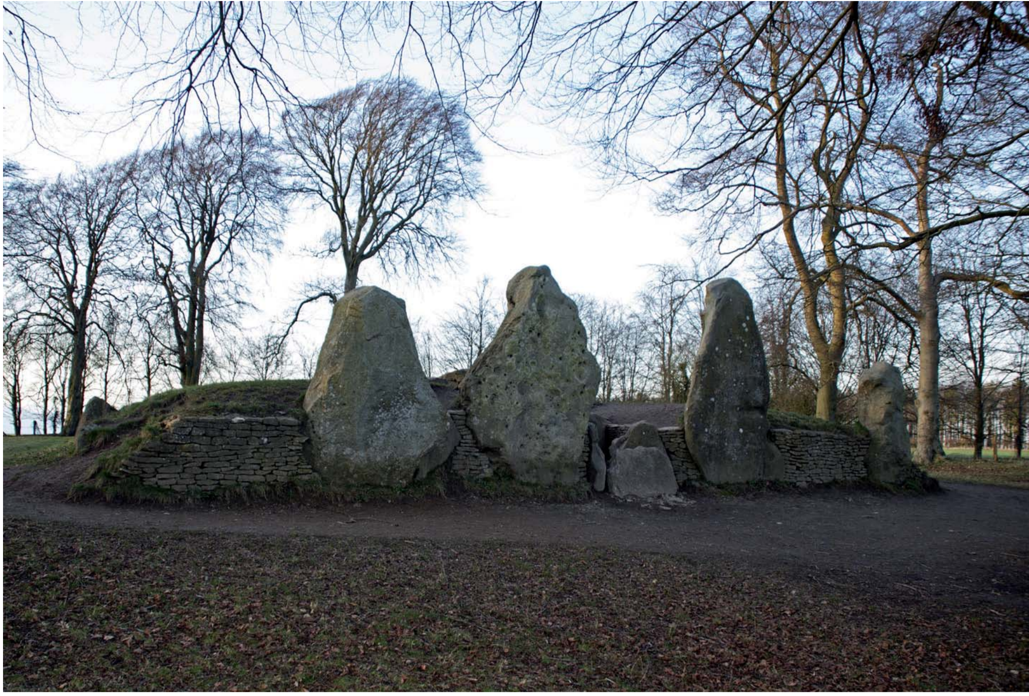
Wayland's Smithy (Oxfordshire) est une structure funéraire originale du néolithique britannique composée successivement de deux tumuli, l'un allongé avec chambre funéraire et l'autre plus ancien sans chambre