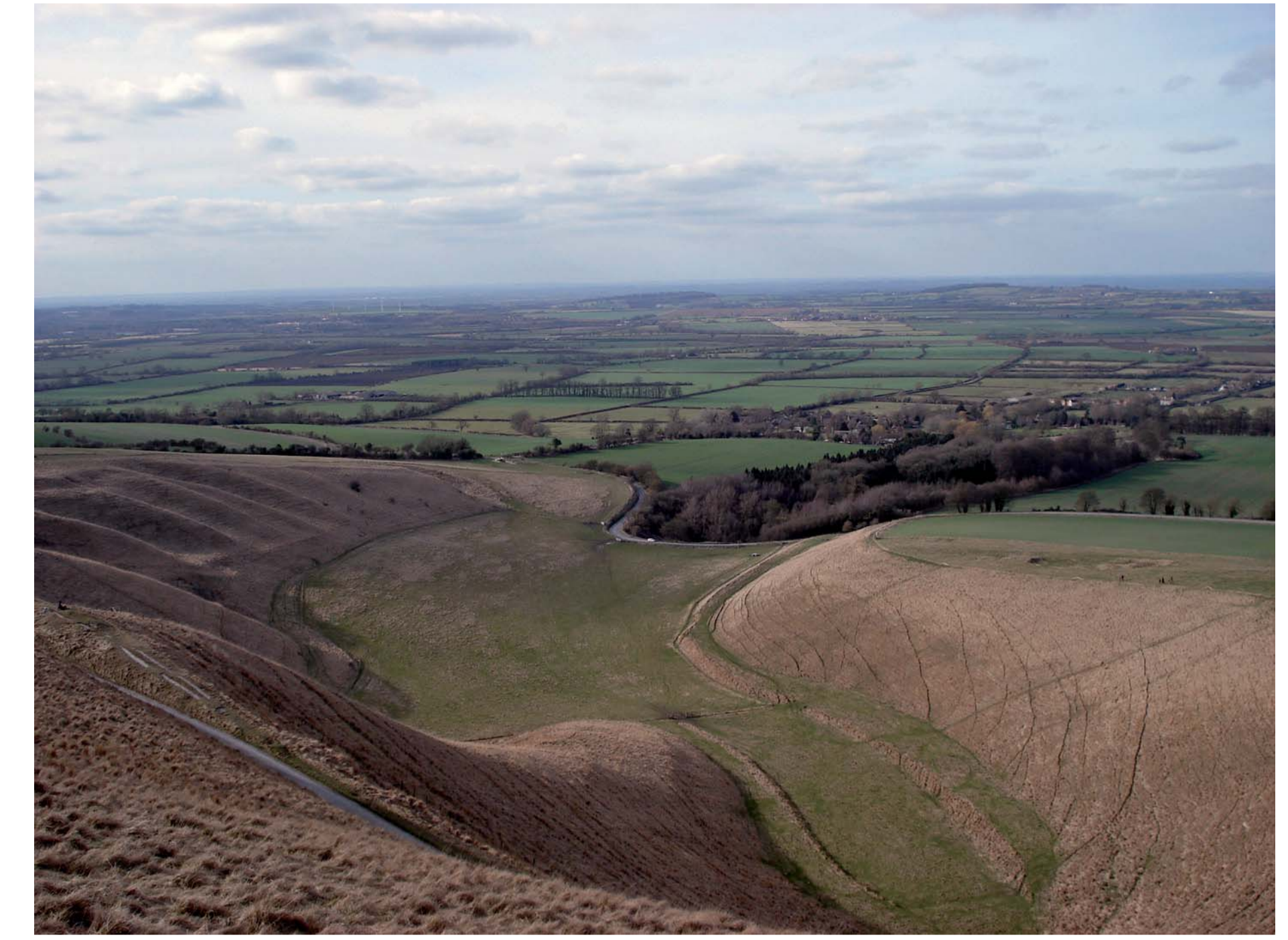
Maiden Castle (Dorset) est le plus grand site fortifié de hauteur d'Europe. Ces constructions datées de l'âge du Fer sont nommées les hillfort