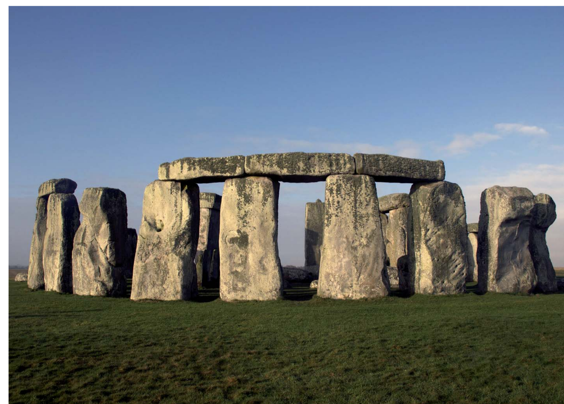
Et oui, Stonehenge (Wiltshire), le plus célèbre et le plus énigmatique des sites préhistoriques...