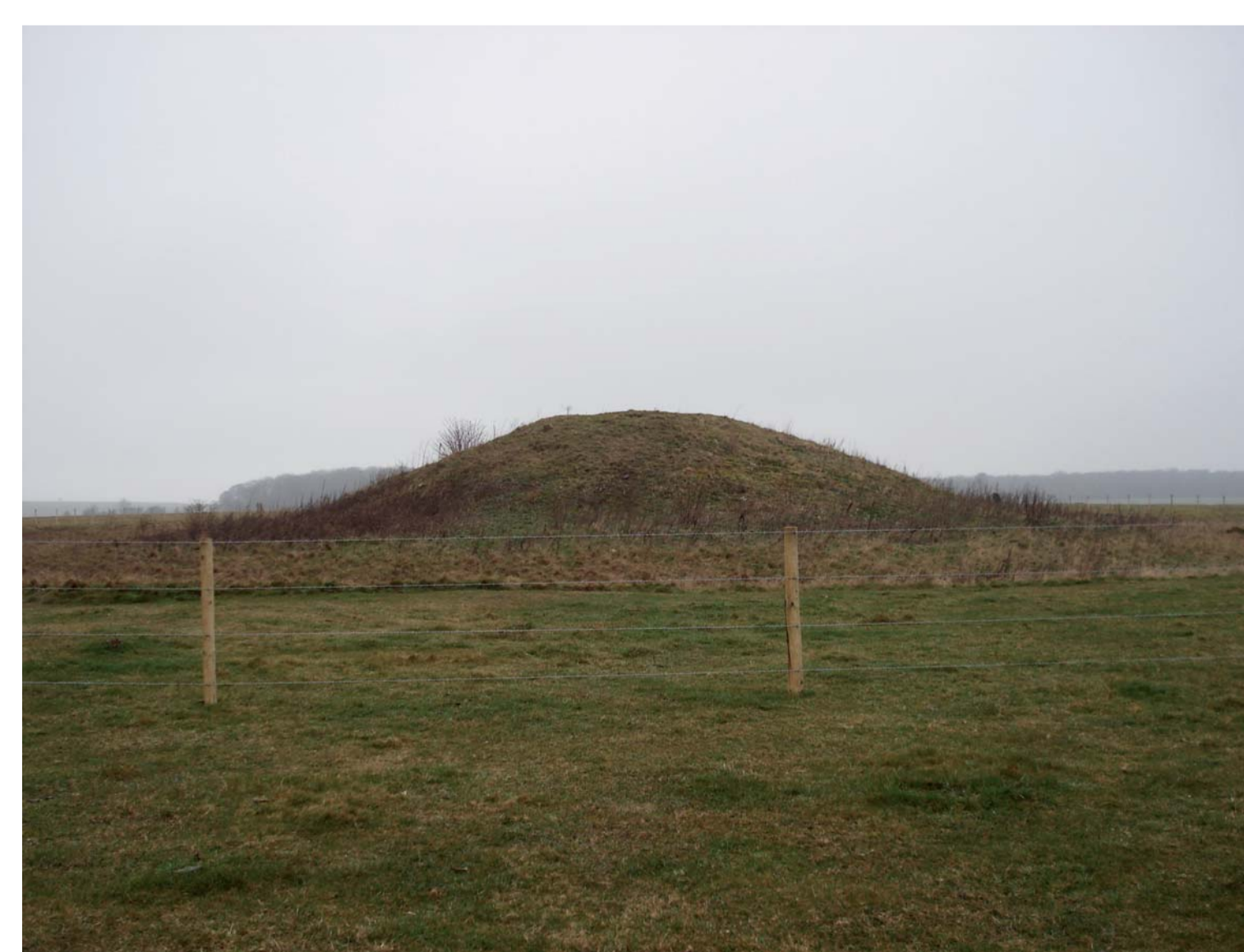
La nécropole de Normanton Down (Wiltshire) composée de monuments funéraires datant du Néolithique - les long barrows - et du Bronze ancien - ici un des round barrows