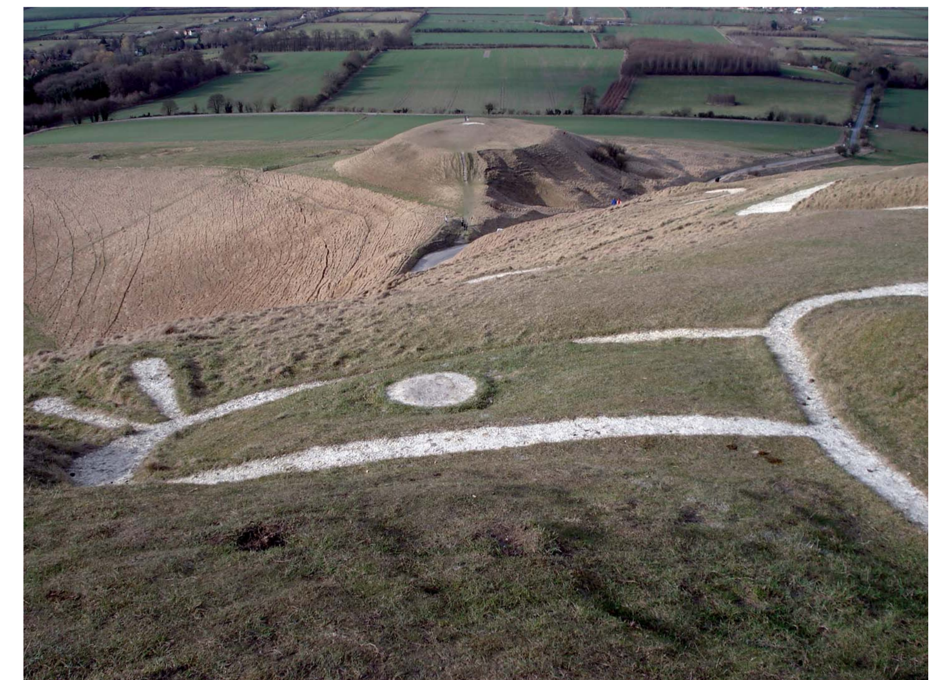
Le White Horse (Oxfordshire) est une figure en craie de 110 m de long qui serait datée de l'âge du Fer. Elle a été dessinée par creusement de tranchées comblées de blocs de craie