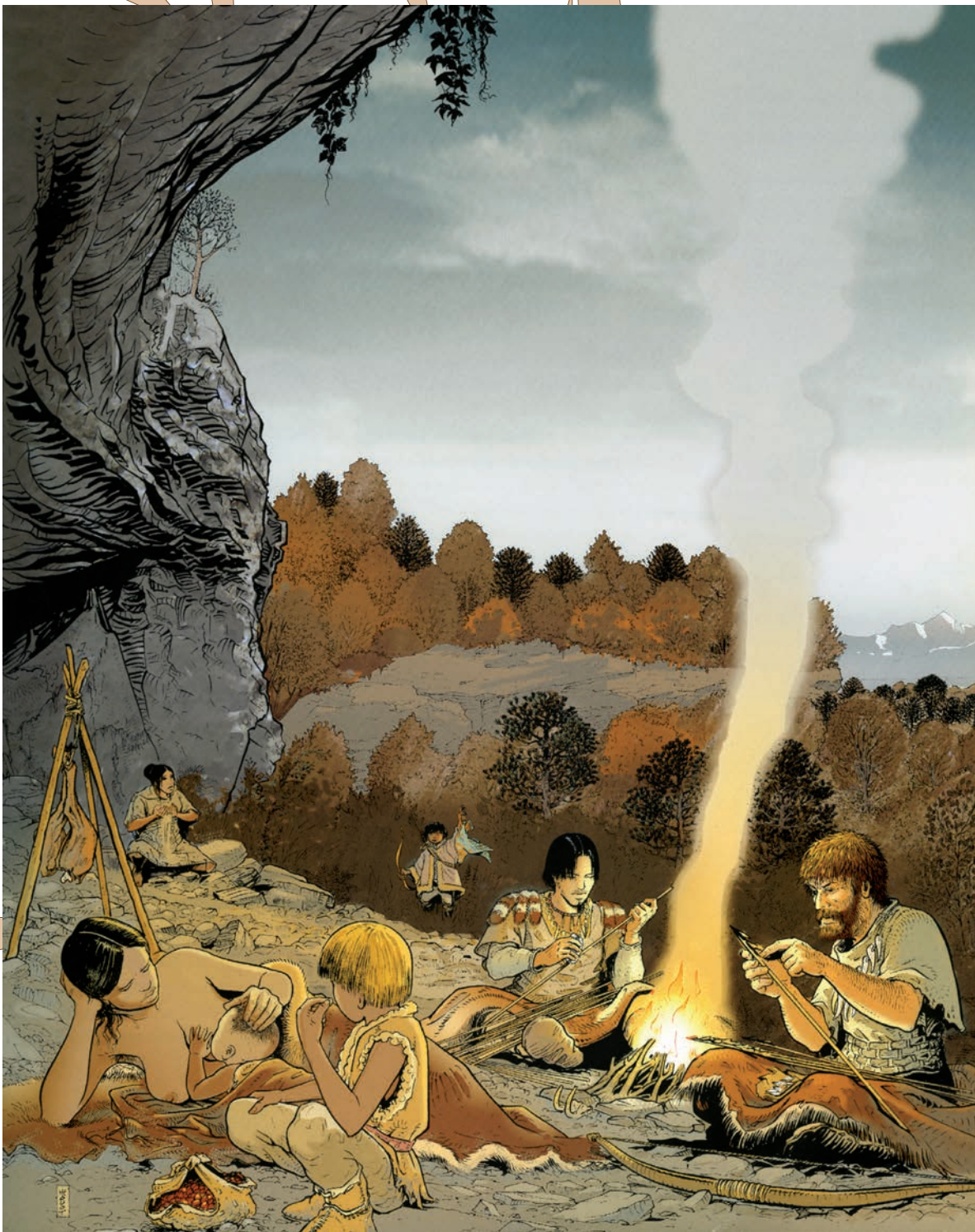
Fig. 1 : Dessin d'une installation d'un groupe familial dans un abri d'altitude du Jura, l'abri Freymond au col du Mollendruz (Mont-la-Ville, Vaud). Image tirée de Gally 2006, dessin d'André Houot