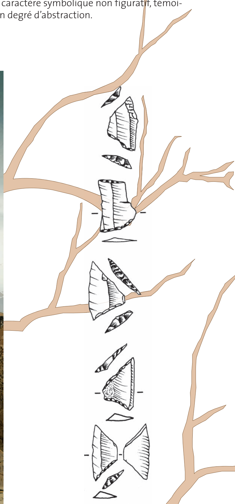
Fig. 2 : Microlithes, trapèzes en silex destinés à l'emmanchement pour la confection de flèches. D'après Pignat et Winiger 1998