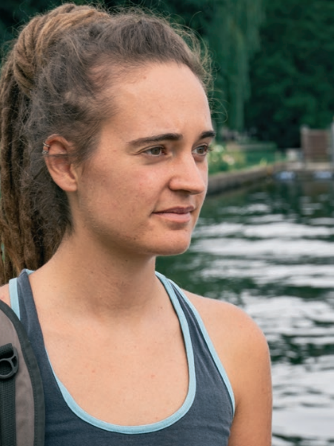
Carola Rackete