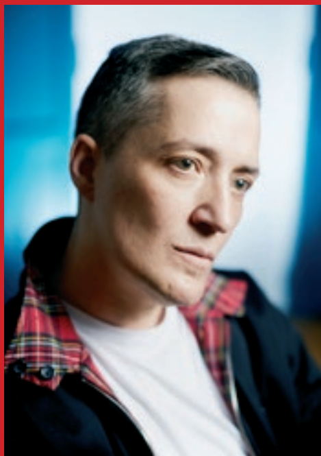
Paul B. Preciado