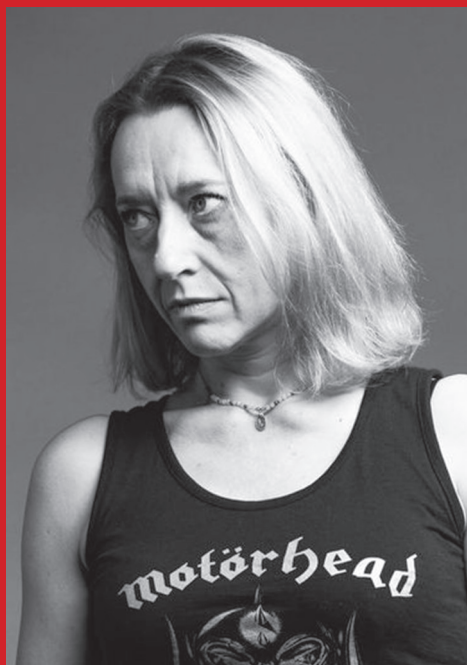
Virginie Despentes