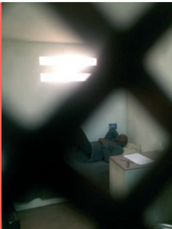
Extrait du film «Free Men» d'Anne-Frédérique Widmann