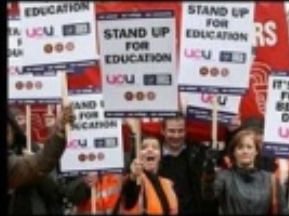
What society thinks I do