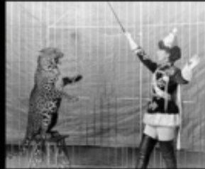
What I really do