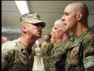
What students think I do