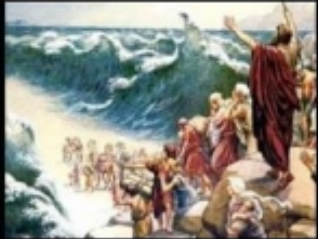
What I think I do