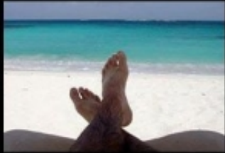
What my friends think I do