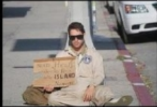
What my mom thinks I do