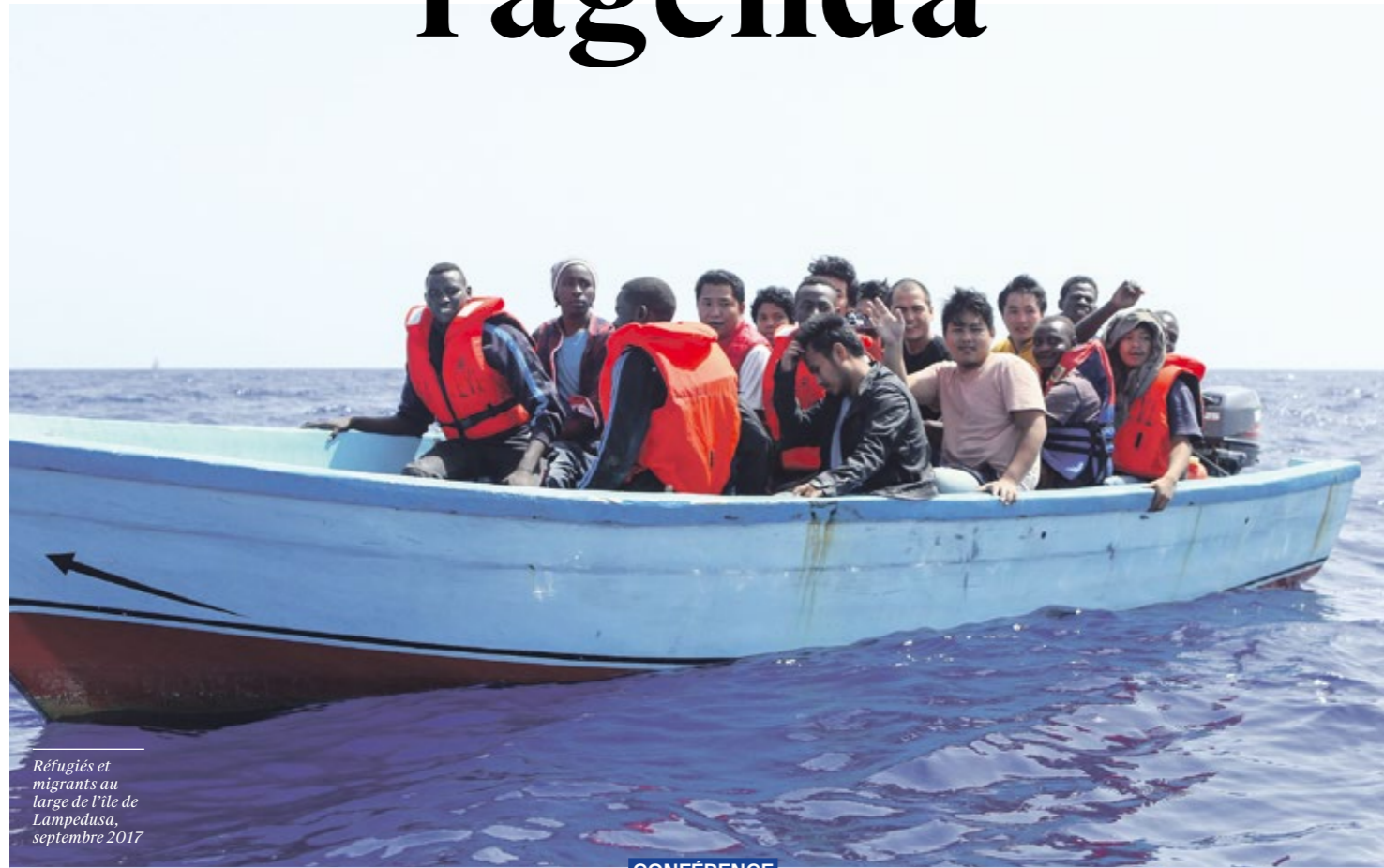
Refugiés et migrants au large de l'île de Lampedusa, septembre 2017