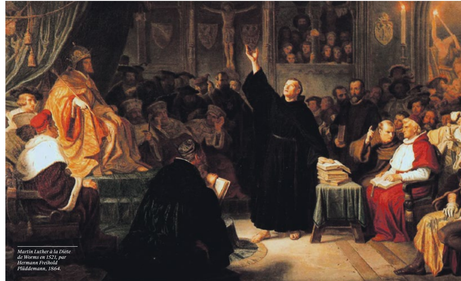
Martin Luther à la Diète de Worms en 1521, par Hermann Freihold Plüddemann, 1864.

Pourquoi Luther a-t-il malgré tout réussi là où d'autres avaient échoué avant lui ?