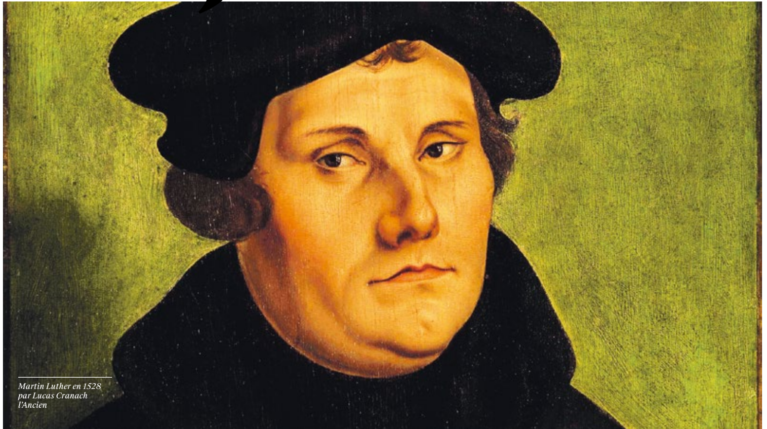
Martin Luther en 1528 par Lucas Cranach l'Ancien