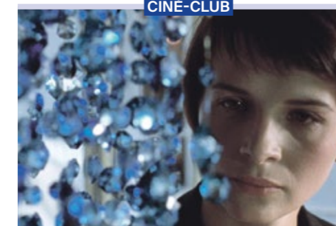
TROIS COULEURS: BLEU (1993), FILM DE K. KIEŚŁOWSKI

DU 2 OCTOBRE AU 18 DÉCEMBRE LE MONDE SELON KIEŚŁOWSKI