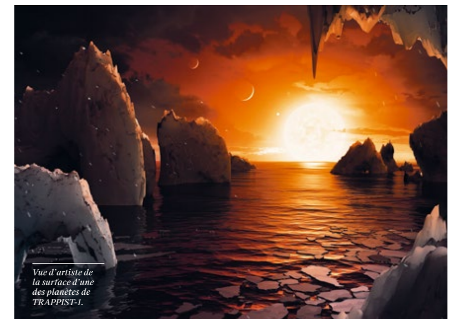
Vue d'artiste de la surface d'une des planètes de TRAPPIST-1.

«Nos résultats suggèrent que les planètes les plus éloignées de l'étoile sont les meilleures candidates pour rechercher de l'eau avec le nouveau télescope spatial James Webb, estime Vincent Bourrier. Ils soulignent cependant aussi la nécessité de réaliser des études théoriques et des observations complémentaires de toutes les longueurs d'onde, dans le but de déterminer la nature des planètes de TRAPPIST-1 et leur potentiel d'habitabilité.» —