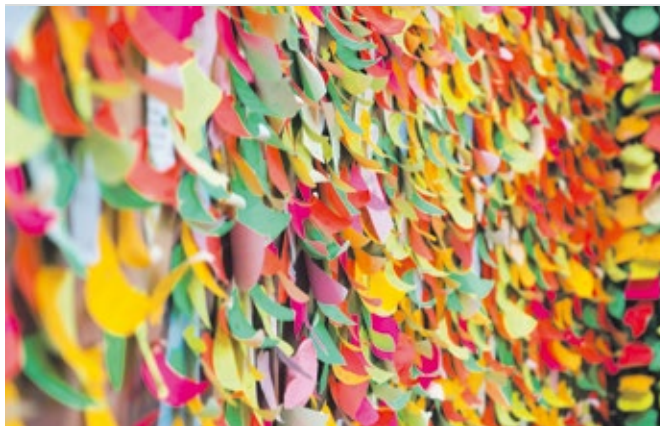
Le post-it, inventé grâce à un adhésif qui collait mal.