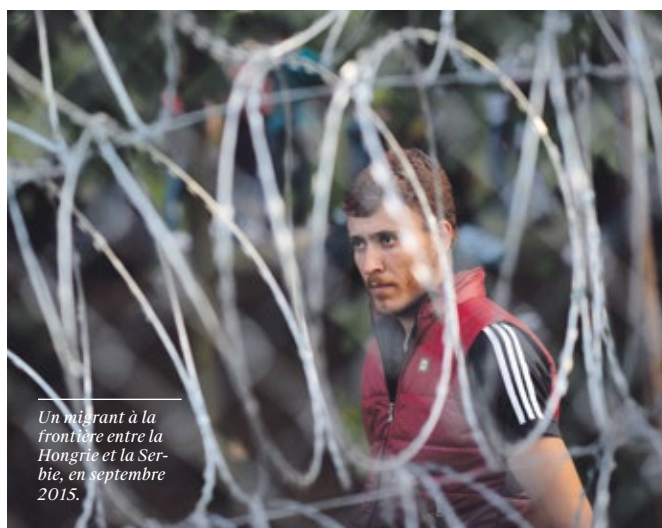
Un migrant à la frontière entre la Hongrie et la Serbie, en septembre 2015.

Les conditions d'accueil difficiles et les contraintes liées à l'intégration rapide dans les pays d'accueil provoquent un épuisement psychique et agissent comme des facteurs de maintien des troubles. Hypervigilance, anxiété, dépression, douleurs somatiques: autant de symptômes résultant de l'insécurité liée au statut de réfugié et à la difficulté de s'intégrer socialement et professionnellement.