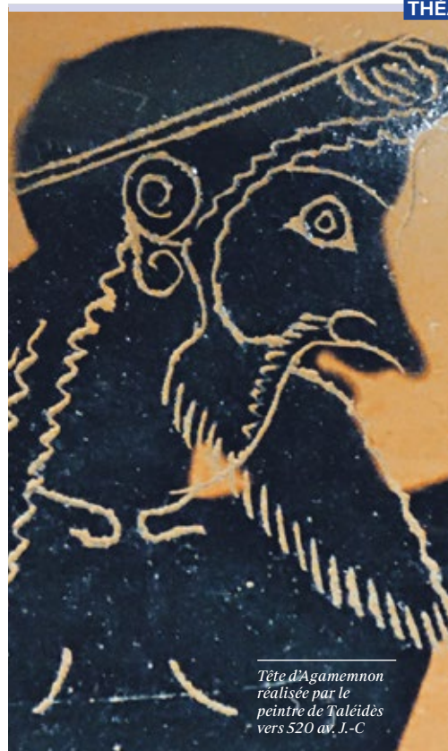
Tête d'Agamemnon réalisée par le peintre de Taléidès vers 520 av. J.-C.

Prochain délai d'enregistrement: Lundi 13 novembre 2017