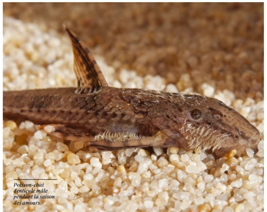
Poisson-chat denticulé mâle pendant la saison des amours.

Les chercheurs tentent désormais de déchiffrer les gènes et les mécanismes moléculaires impliqués, chez les poissons-chats, dans la formation de l'os et de la dent et qui permettent à cette dernière de se développer et de se régénérer.