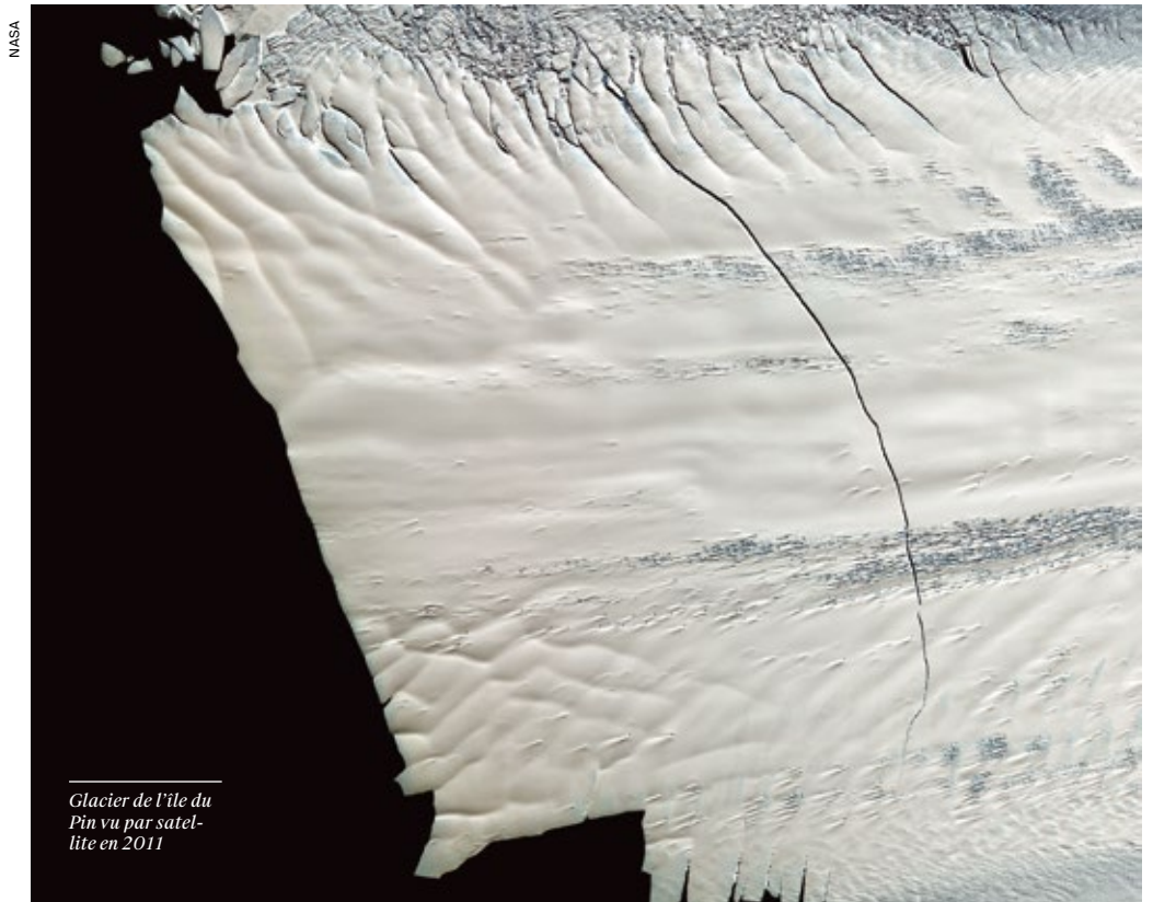
Glacier de l'île du Pin vu par satellite en 2011

La perte de glace en Antarctique occidentale contribue de manière très importante à la montée du niveau des océans mais représente aussi une des incertitudes majeures entachant les prédictions concernant les variations futures. L'étude parue dans Nature fournit des explications sur la manière dont le phénomène s'est enclenché. L'étape suivante consiste désormais à tenter de savoir combien de temps le phénomène perdurera et combien d'eau douce le glacier de l'île du Pin et ses voisins vont relâcher dans les océans. —