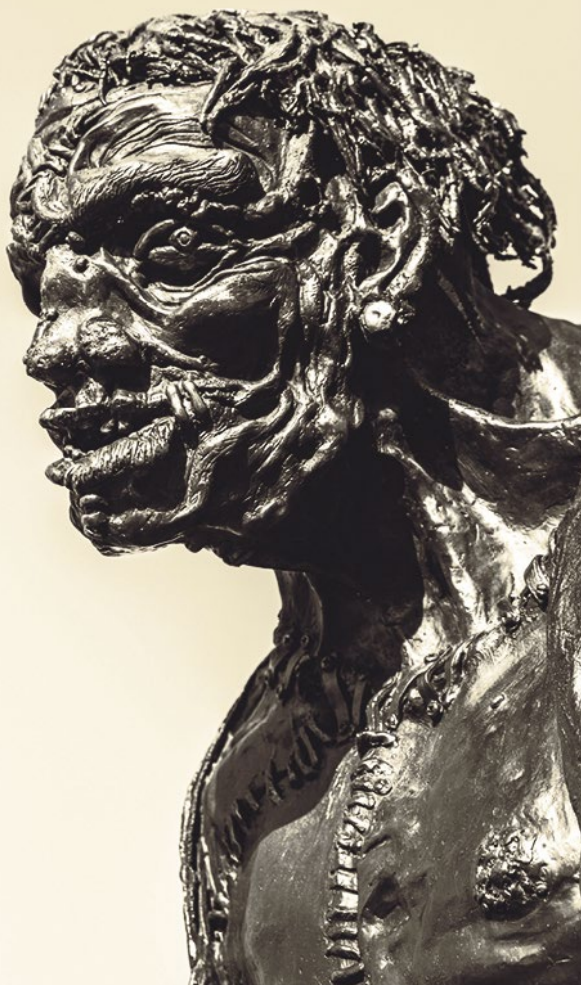
«Frankie a.k.a. The Creature of Doctor Frankenstein» Statue visible sur la Plaine de Plainpalais, Genève