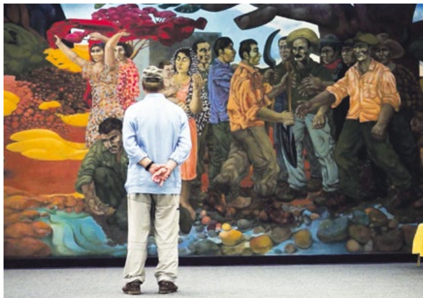
Jean Ziegler à Cuba, contemplant une fresque typique de l'iconographie révolutionnaire

Jean Ziegler, c'est avant tout une voix, un accent et un vocabulaire reconnaissables entre tous: «La dictature mondiale du capital financier», «les oligarques» et «l'ordre cannibale» qui autorisent le «crime organisé de la faim», car «un enfant qui meurt de faim est un enfant assassiné». Ce sens de la formule et cette conscience du poids des mots, Jean Ziegler l'explique dans l'un des passages les plus captivants du film où, dans les travées du Palais des Nations à Genève, il réagit à chaud à une tentative de suppression de l'expression «Fonds vautour» pour parler, dans un rapport du Conseil des droits de l'homme, des fonds d'investissement spéculatifs. Il y voit une tentative des puissants de semer la discorde parmi les membres du Conseil: «Ils at-