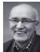
Professeur ordinaire FPSE Section des sciences de l'éducation