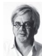
Professeur ordinaire FPSE Section des sciences de l'éducation