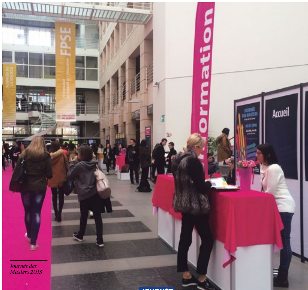
Journée des Masters 2015