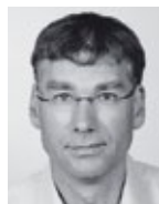
Professeur ordinaire Faculté des sciences Département de biochimie