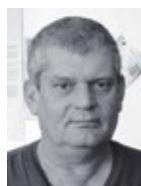
Professeur associé Faculté des lettres Département de linguistique