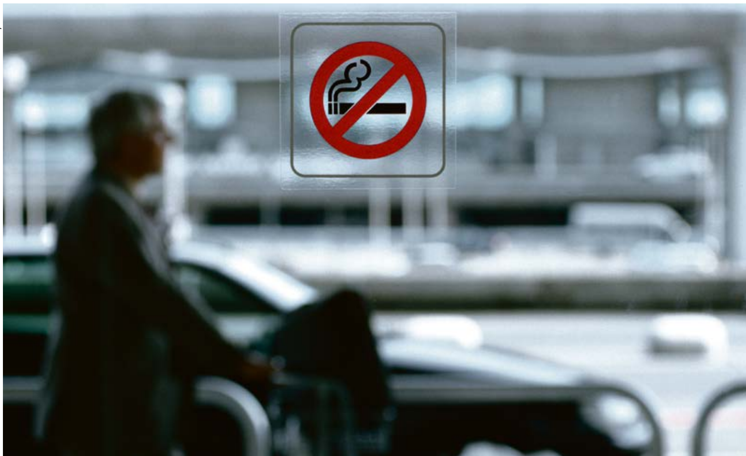
A Genève, l'interdiction de fumer dans les lieux publics a entraîné une diminution de près de 20% des hospitalisations pour broncho-pneumopathie obstructive chronique et pneumonie.