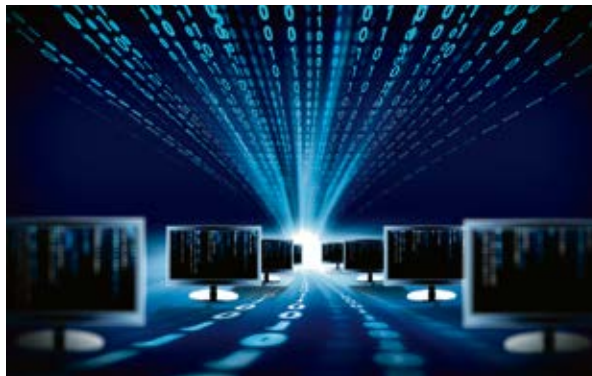
«Crowdcrafting» contribue à la cyberscience citoyenne.