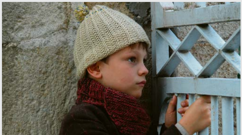
Image tirée du film «Les Choristes» (France, 2004) qui retrace l'histoire d'enfants placés.

| JEUDI 30 MAI | Conférence: La protection de l'enfance en danger. Histoire d'une politique interventionniste 18h30 | Théâtre St-Gervais 5 rue du Temple www.enfances-volees.ch