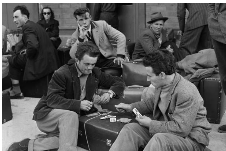
Travailleurs italiens à leur arrivée en Suisse, Brigue, 1956.

Philippe Wanner: En Suisse, le phénomène migratoire s'est complexifié au fil du temps. La migration traditionnelle, venue d'Italie, d'Espagne, de France ou d'Allemagne a pris de l'ampleur. Une migration plus récente a également vu le jour, en provenance par exemple des Balkans. Les migrants actuels sont en général plus mobiles et motivés par des considérations économiques que leurs prédécesseurs: ils ne demeurent en majorité pas en Suisse mais retournent un jour ou l'autre dans leur pays d'origine avec leur famille. C'est une différence majeure avec les migrants de la génération précédente, dont beaucoup se sont implantés de manière durable. De temporaire, la migration est donc devenue circulaire, avec un brassage continu au sein de la population suisse.