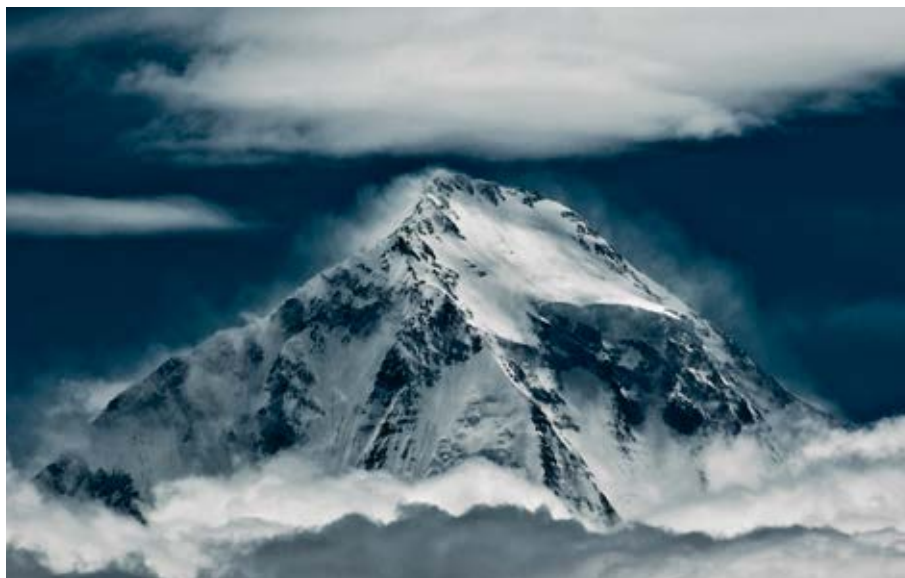
Le Dhaulagiri, le septième plus haut sommet du monde, dans la chaîne de l'Himalaya.

Les données actuelles sur les pertes de masse des glaciers himalayens sont quasi inexistantes. La plus haute chaîne montagneuse du monde possède plus de 20 000 glaciers, seuls une dizaine d'entre eux, souvent les plus accessibles et les plus emblématiques mais pas forcément les plus représentatifs au niveau du changement climatique, ont été étudiés en détail.