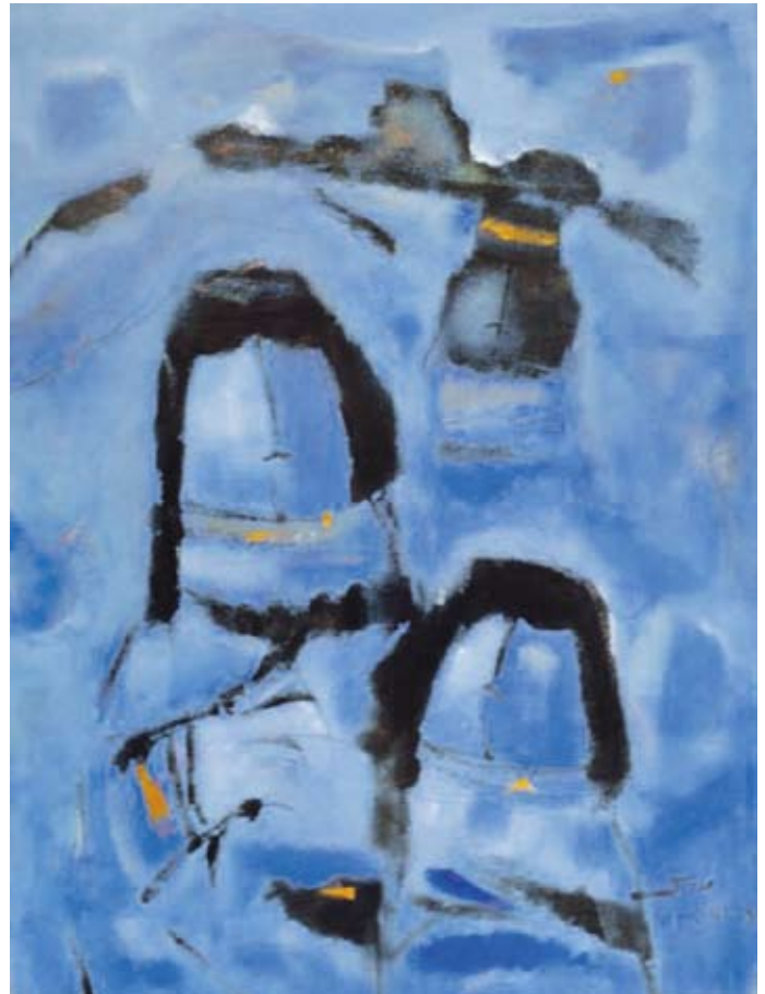
Tableau de Fateh Moudarres. Image: DR

Modernes ou islamiques? Les arts visuels dans le monde arabe aujourd'hui de 16h à 18h Uni Mail, salle M1170 Entrée libre www.unige.ch/lettres/elcf/Actualites/interculturalite.html