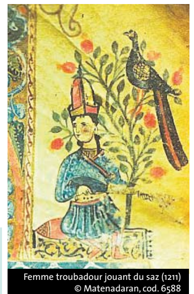
Femme troubadour jouant du saz (1211)