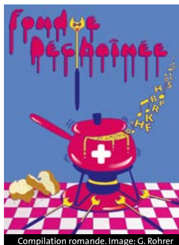
Compilation romande.

Les paroles des 20 chansons sélectionnées sont données dans le livret et sont accompagnées de fiches pédagogiques. Celles-ci proposent, en plus d'un lexique, des activités de sensibilisation pour mettre les sens