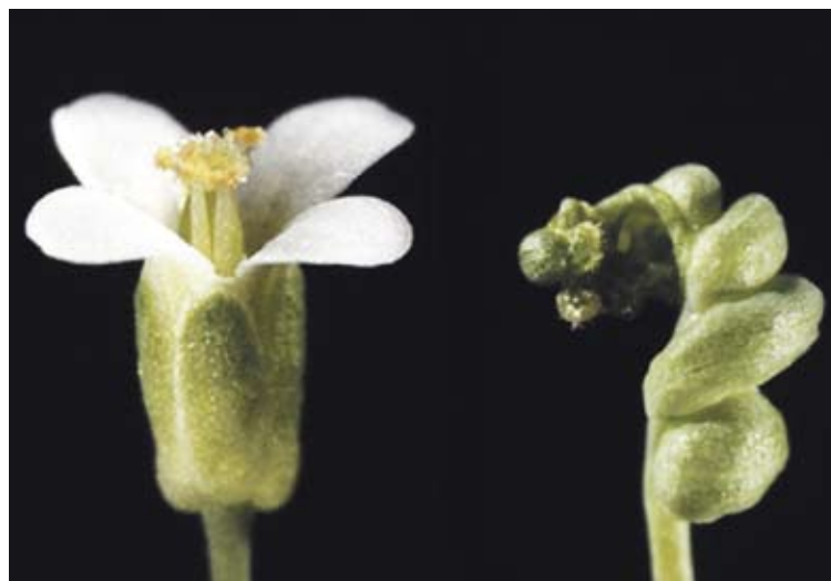
Arabidopsis thaliana , la plante vedette des laboratoires de biologie.

Pour leurs analyses, les spécialistes ont cultivé des générations d' Arabidopsis , dont certaines ne présentaient plus de fleurs. Ils ont alors observé que ce défaut, signe d'une mutation, découlait du saut d'Evadé. ■