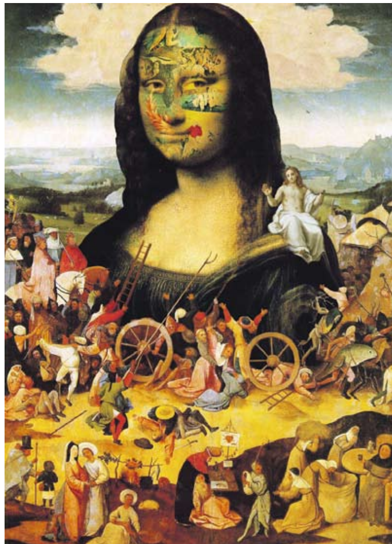
«Mona Lisa Remix». Image: N. Coates