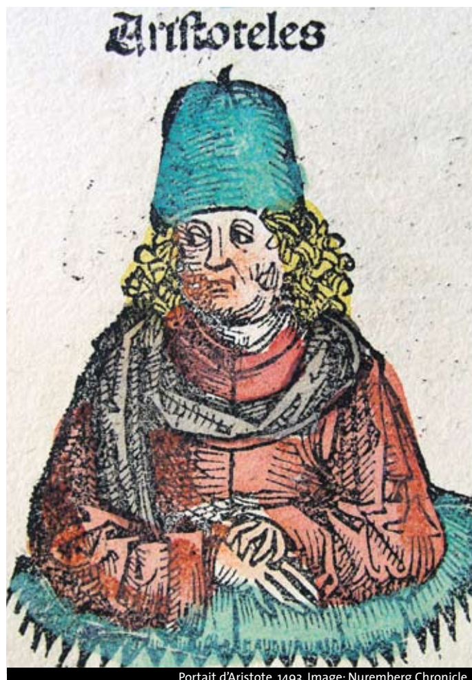
Portrait d'Aristote, 1493. Image: Nuremberg Chronicle

Science moderne et savoir antique: quelques réflexions sur la signification et les véritables enjeux de l'expérimentation de 18h15 à 19h Uni Bastions, salle B101 Entrée libre www.unige.ch/lettres/antic/Actu-Coll-Conf/actualites/fabriquesavoir.html