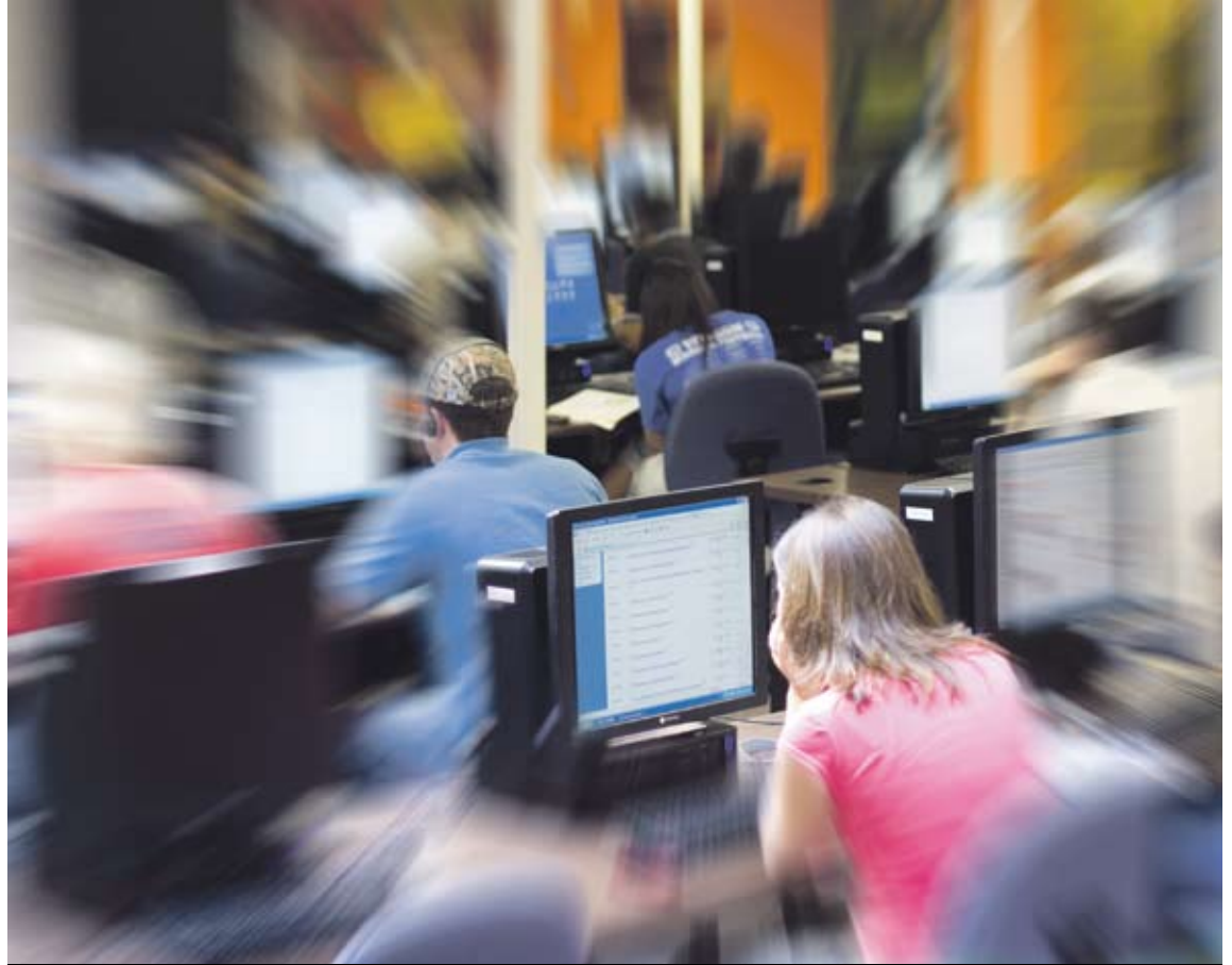
Selon une enquête réalisée à l'Université de Lyon en 2007, 4 étudiants sur 5 déclarent avoir recours au «copier-coller» et 9 enseignants sur 10 ont été confrontés à ce type de pratiques.

«Tout le monde, dans le milieu académique, emploie Internet comme source d'information, inutile d'en énumérer les avantages, relève Yves Flückiger. Je crains parfois que cela ne renforce une tendance à une certaine forme de consumérisme, au détriment de la réflexion personnelle. Cela étant, j'espère aussi que ces outils plus précis vont permettre de relativiser l'ampleur du phénomène, car dans les faits, les plagiats graves restent peu courants.»