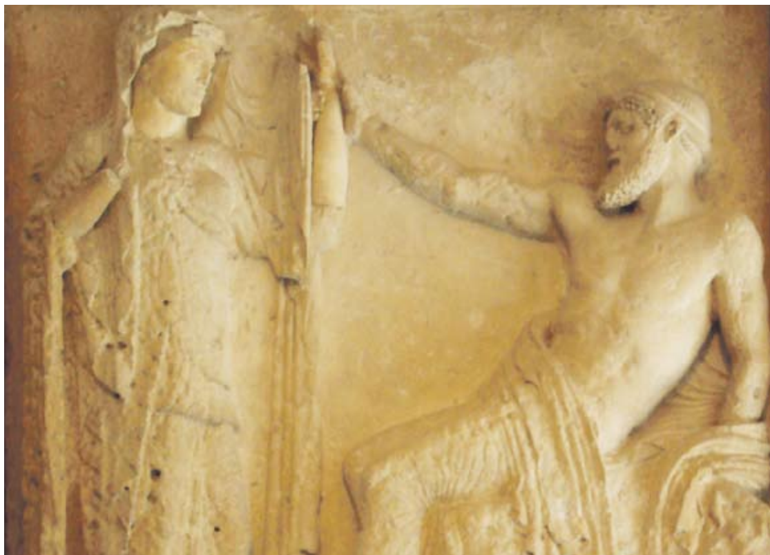
Zeus et sa femme Héra. Musée archéologique de Palerme.