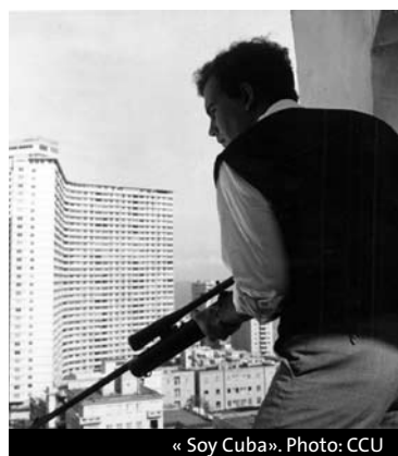
«Soy Cuba».

Lundi 14 décembre, 20h « Messidor » d'Alain Tanner (1979, 123')