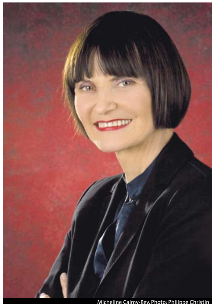
Micheline Calmy-Rey.