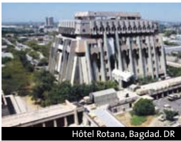
Hôtel Rotana, Bagdad.

18h • Bagdad. Architecture XX e siècle. Un patrimoine en péril par Caecilia Pieri (chercheuse à l'Ecole des hautes études en sciences sociales, F). Institut national genevois, 1 Promenade du Pin.