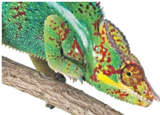
Caméléon panthère Furcifer pardalis.