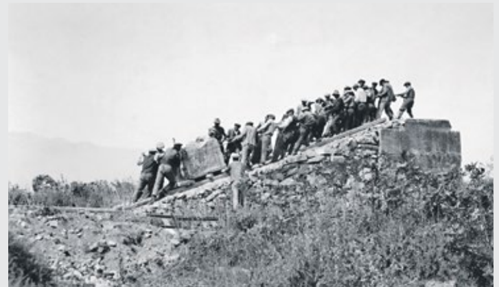
Remise en place d'un bloc d'une basilique de Philippes, vers 1930.

Fondée en 356 av. J.-C. par le père d'Alexandre le Grand, la ville de Philippes, en Grèce du Nord, occupe une place de choix dans l'histoire de l'Antiquité. C'est là qu'Octave et Antoine, les héritiers de César, remportèrent la victoire sur ses assassins, Brutus et Cassius. C'est également à cet endroit qu'en 49 l'apôtre Paul fit son premier séjour sur le continent européen. Ce site exceptionnel, aujourd'hui candidat pour une inscription au patrimoine mondial de l'Unesco, a fait l'objet, durant plus de cent ans, de fouilles archéologiques menées par l'Ecole française d'Athènes et relatées dans une importante exposition.