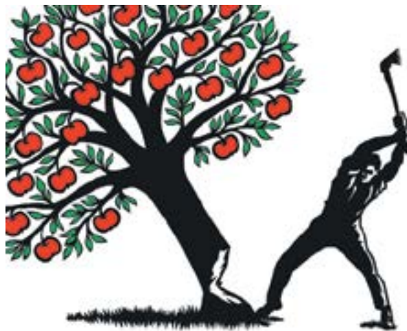
Affiche des opposants à l'initiative adoptée le 9 février 2014.

Aujourd'hui, il est impossible de mesurer le nombre d'abandons de candidats