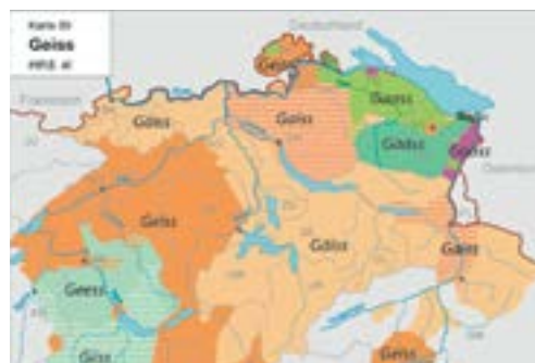
Carte linguistique du mot Geiss.

Disponible depuis le 5 janvier sur iPhone et An-