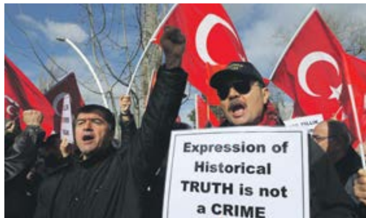
Manifestants turcs devant l'ambassade de Suisse à Ankara en janvier dernier.

La liberté d'expression est un élément essentiel des droits de l'homme et il faut défendre ce droit, y compris dans le cas d'idées qui heurtent ou qui dérangent. Si on ne donnait la liberté d'expression qu'aux seules idées convenues, il n'y aurait pas de démocratie. Toutefois, les idées ra-