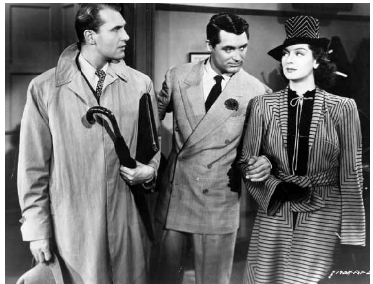
«His Girl Friday», lundi 28 mars.

12h-12h45 • Discussion Salle B111, Uni Bastions.