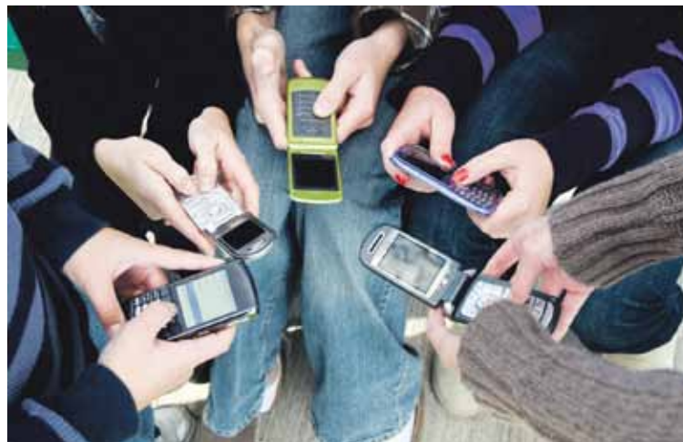
98% de la population observée détient un téléphone portable.

Les auteurs de l'étude ont par ailleurs cherché à définir la nature des données que les jeunes diffusent sur le Net. Si plus de 80% des jeunes