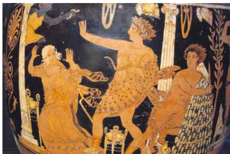
Oreste et les furies, Vase à figure rouge, 370 av. J.-C. Musée national archéologique de Naples.

En Egypte, en Grèce, à Rome, en Mésopotamie, les textes révèlent, en effet, que les divinités sont en proie à une large palette d'émotions. Certaines sont habitées par la colère, le deuil, voire la peur. Elles passent par des états extrêmes de haine ou de tristesse ou, au contraire, elles sont représentées comme impassibles, jouissant d'une sérénité im-