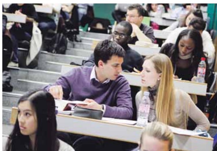
Atelier de l'Ecole d'avocature.