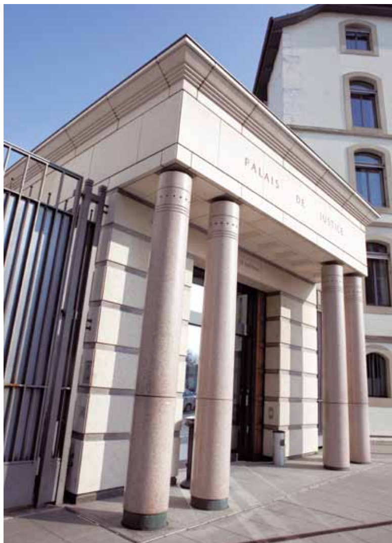
Nouvelle entrée du Palais de justice à Genève.