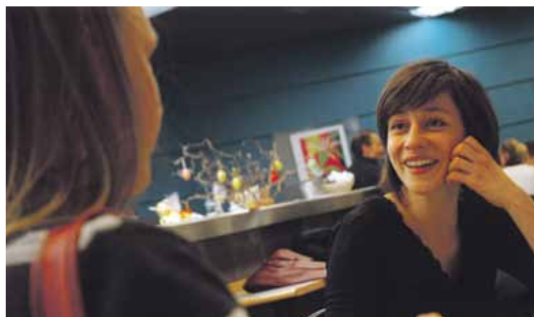
Un partage d'expériences.

Ainsi, pour la période 2010-2011, 28 tandems mentor/mentee ont été mis en place. Au vu du succès de l'entreprise, une nouvelle édition est lancée cette année. Les inscriptions sont ouvertes jusqu'au 17 avril prochain.