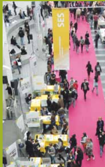
Présentations à Uni Mail.