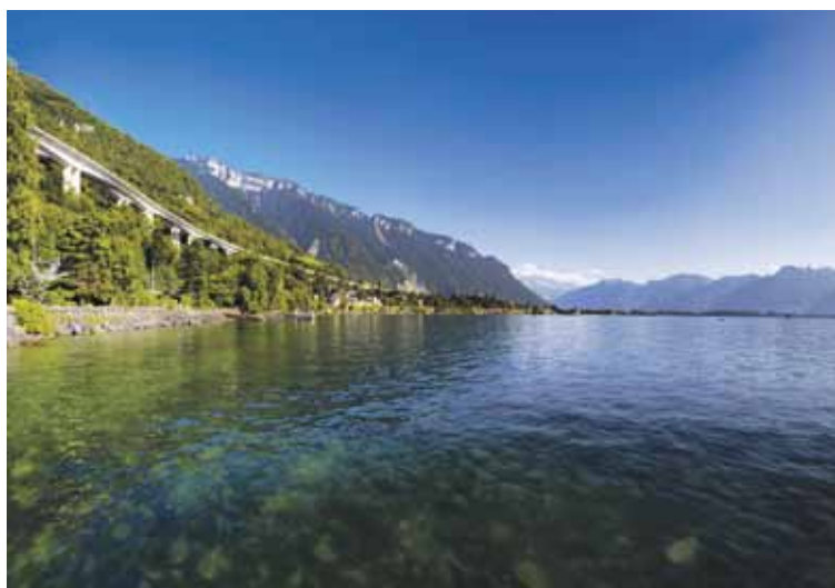
L'état de santé du Léman s'est amélioré ces dernières décennies, mais ses eaux contiennent trop de micropolluants.

Plusieurs tonnes de micropolluants sont déversées chaque année dans les eaux du Léman. On en a compté environ 15 tonnes, en 2010, rien que pour les pesticides, auxquelles se sont ajoutées quelque 50 tonnes de médicaments et d'agents anticorrosion. Des quantités jugées alarmantes par la Commission internationale pour la protection des eaux du Léman (Cipe), qui a décidé de placer la réduction de ces substances en tête des priorités de son plan d'action 2011-2020. Elle pourra s'appuyer en cela sur les travaux d'un projet financé par le Fonds national suisse de la recherche scientifique, mené en partenariat par l'UNIGE (Institut Forel), l'UNIL, l'EPFL et l'EAWAG, le principal institut de recherche sur l'eau en Suisse, basé à Dübendorf dans le canton de Zurich.