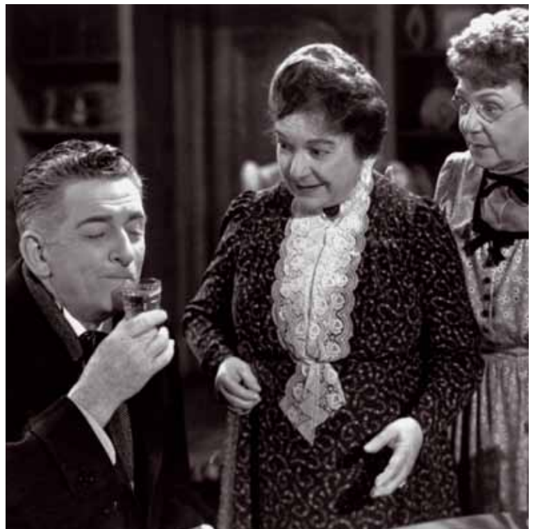
«Arsenic et vieilles dentelles», lundi 7 mars, 20h.