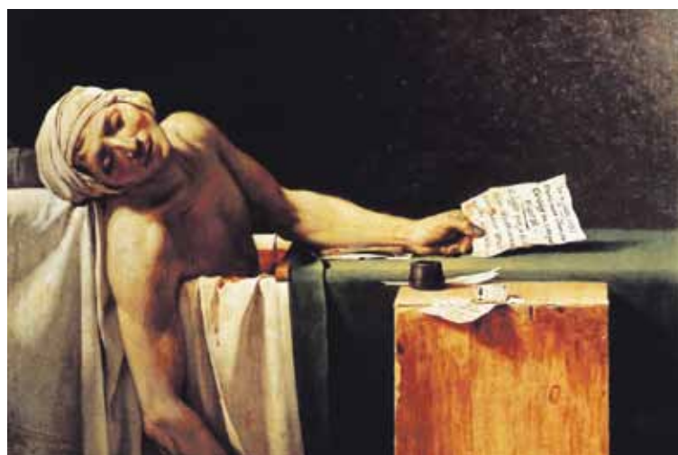
Détail de «La Mort de Marat», Jacques-Louis David, 1793 Musées royaux des beaux-arts de Bruxelles

Les magistrats assermentent des professionnels dans de nombreux corps de métier pour qu'ils éclairent