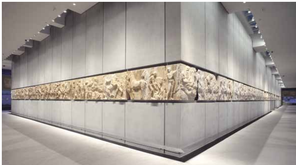
Galerie des frises du Parthénon, Musée de l'Acropole.

Les personnes impliquées dans ce trafic perpétuent une sorte de droit de cuissage sur des pays qui sont spoliés d'une partie de leur patrimoine. Elles considèrent cette pratique comme un droit naturel. Les avions, les bateaux et même certaines valises diplomatiques qui sortent du Pérou sont parfois remplis d'objets précolombiens. C'est un commerce organisé, avec ses dealers et ses revendeurs. Et parfois, on n'est pas loin du pur banditisme. Le marché de l'art offre de très bons investisse-