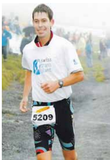
Patient transplanté du foie au marathon de la Jungfrau.

En Suisse, on estime que seuls 20% de la population sont porteurs d'une carte, alors que la majorité est pourtant favorable au don. Ainsi, le pays se situe en retrait par rapport à ses voisins européens, avec 12,6 don-