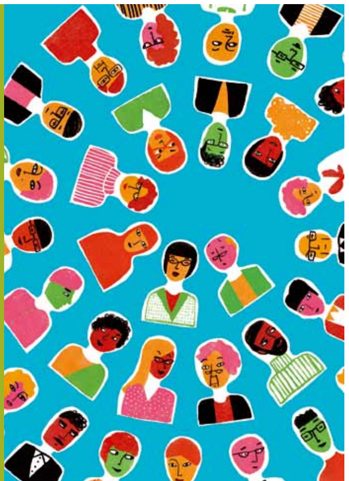
Illustration: Mirjana Farkas

Une capitale pour les droits humains? à 18h30 Uni Mail www.unige.ch/public