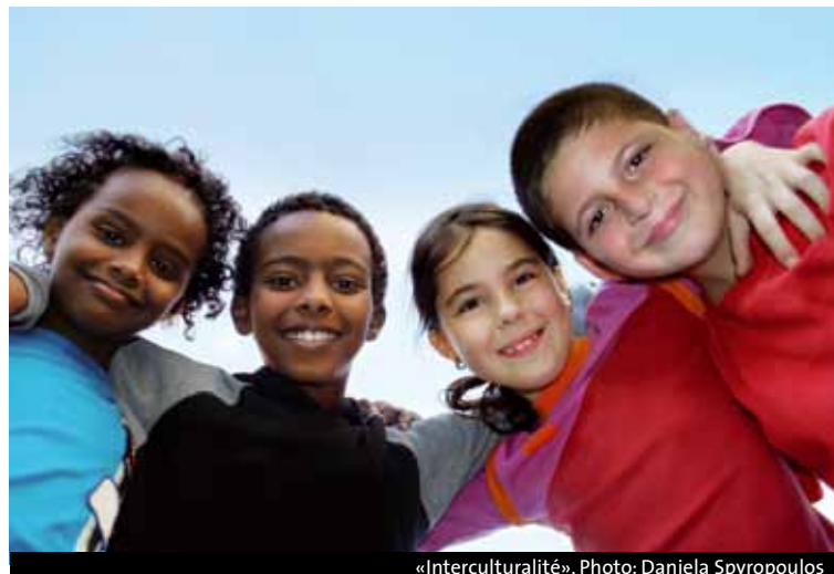
« Interculturalité », Photo: Daniela Spyropoulos