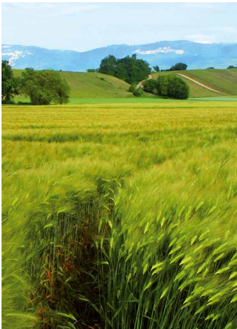
La production agricole de la région genevoise couvre près de la moitié des besoins de la population.