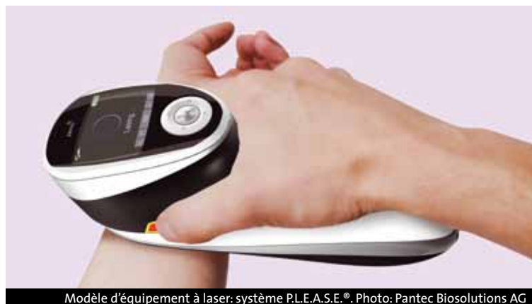
Modèle d'équipement à laser: système P.L.E.A.S.E.®.

«L'idée d'employer des patchs n'est pas nouvelle, explique le Dr Kalia. Ils sont notamment utilisés dans le traitement du tabagisme et sont généralement bien tolérés. Mais le nombre de substances pouvant transiter par ce biais était jusqu'à présent limité