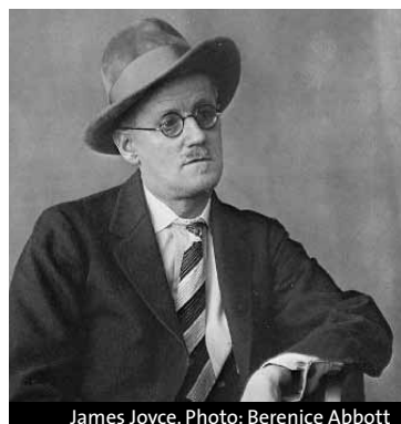
James Joyce.