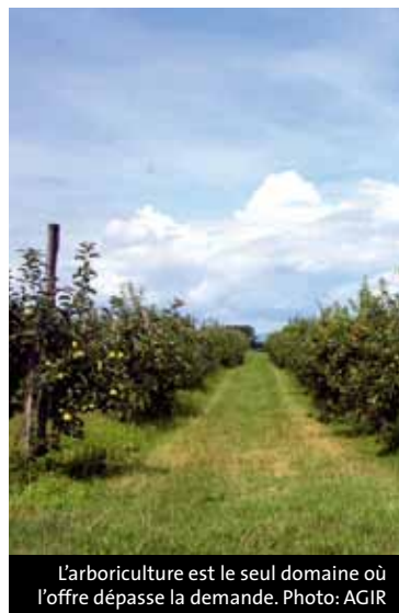
L'arboriculture est le seul domaine où l'offre dépasse la demande.

Aujourd'hui, la hausse des prix du pétrole et l'augmentation du coût des transports qui en est la conséquence directe poussent de nombreuses collectivités à plaider pour une plus grande souveraineté alimentaire. Côté consommateur, la mode du «bio», le désir de consommer des produits alimentaires