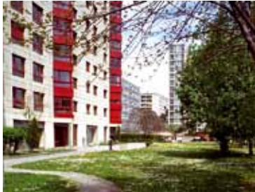
La Cité universitaire à Champel.

Le Conseil d'Etat a donné son feu vert, le 11 novembre, à la réalisation de 75 logements pour étudiants, totalisant 288 lits, au chemin Edouard-Tavan, à quelques encablures de la Cité universitaire. Les nouveaux bâtiments comprendront également une crèche, un bureau, un espace sportif et des salles communes pour les loisirs et diverses activités.