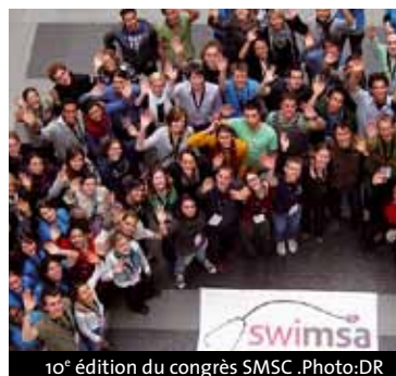
10 e édition du congrès SMSC.

C'est pour répondre à cette question que, les 5, 6 et 7 novembre 2010, des étudiants en médecine de toute la Suisse se sont retrouvés à Genève pour le 10 e congrès Swiss Medical