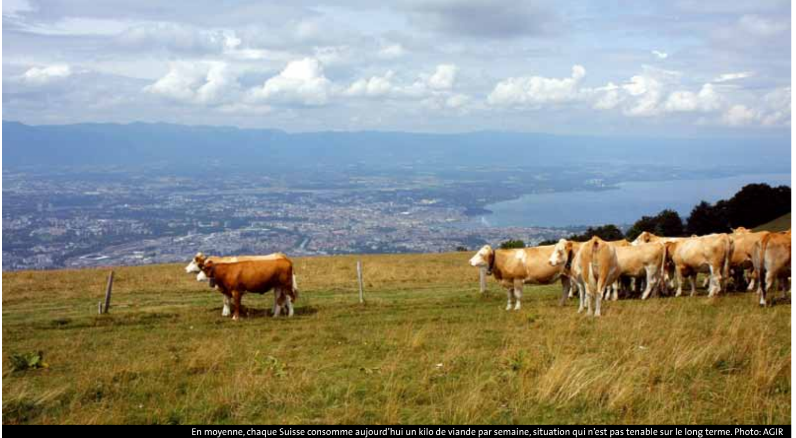
En moyenne, chaque Suisse consomme aujourd'hui un kilo de viande par semaine, situation qui n'est pas tenable sur le long terme.

légumes. Afin de pouvoir approvisionner le marché tout au long de l'année, les tomates, qui représentent le plus gros de la production locale, sont en effet cultivées sous des serres qui sont chauffées hors de la période estivale. Conséquence: le soleil ne représente que 15% des intrants énergétiques, contre 52% pour le chauffage et 28% pour l'énergie grise.