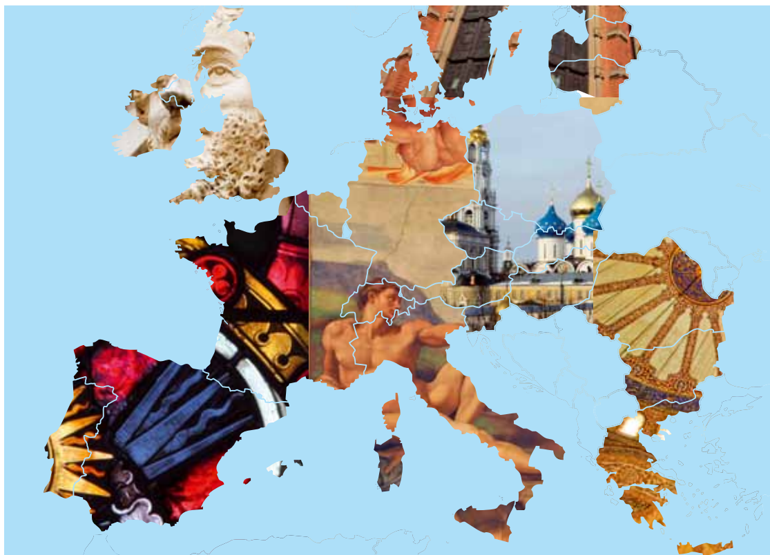
Illustration: L. Monnin/UNIGE