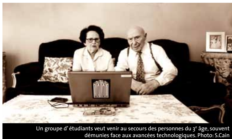
Un groupe d'étudiants veut venir au secours des personnes du 3 e âge, souvent démunies face aux avancées technologiques.

Une vingtaine de projets ont ainsi été déposés par des groupes de quatre ou cinq étudiants qui ont usé de toute leur ingéniosité pour créer des événements innovants et utiles,