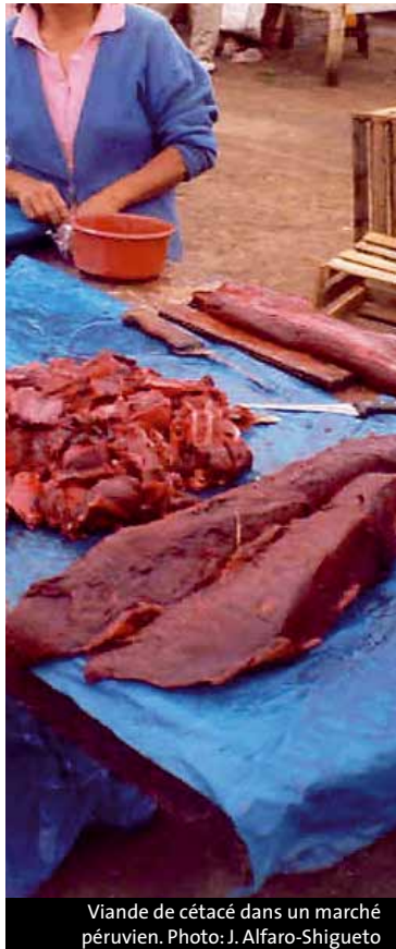
Viande de cétacé dans un marché péruvien.

| ZOOLOGIE | Au large des côtes péruviennes, les prises «accidentelles» de dauphins et marsouins représentent une sérieuse menace d'extinction, comme le montrent de récents travaux de génétique moléculaire