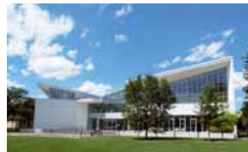
Smith College à Northampton.