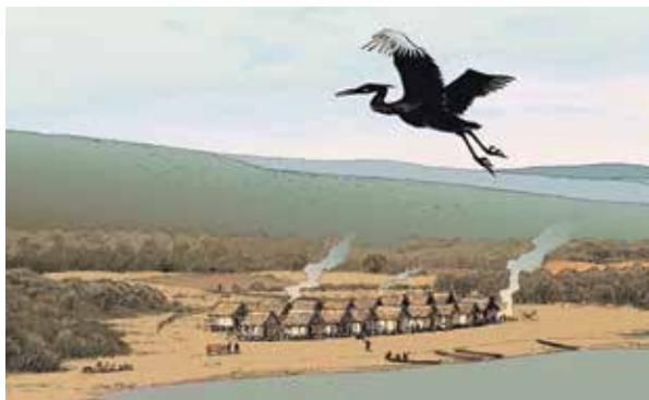
Morges/Les Roseaux, âge du Bronze.

A ux alentours de 1750 av. J.-C., les habitants des rives du Léman ont essuyé un tremblement de terre suivi d'un raz-de-marée d'une rare violence. Dévastés, certains villages sur pilotis ont alors été abandonnés. A l'appui de ce scénario: les restes d'un glissement de terrain gigantesque retrouvés dans les sédiments du Grand-Lac, entre Lausanne et Evian, et décrits dans un article à paraître en janvier dans la revue Earth and Planetary Science Letters .