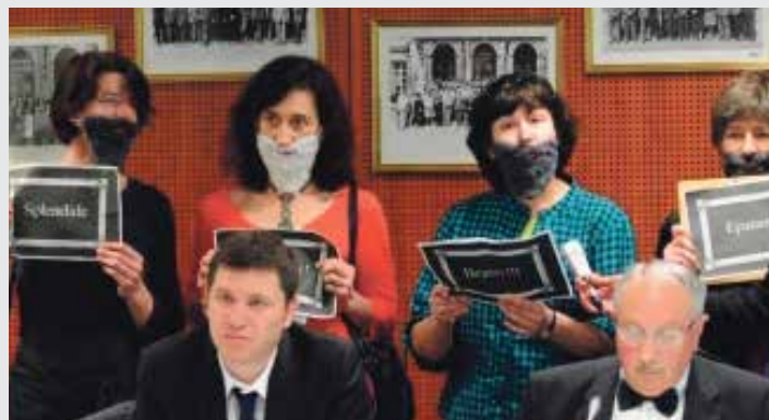
Collectif féministe «La barbe» protestant contre la non-représentation des femmes.

Comment se fabrique la différence entre les hommes et les femmes? Quels mécanismes sont mis en place lorsque l'on a recours à des stéréotypes? Ce sont les questions auxquelles Fabio Lorenzi-Cioldi, professeur de psychologie à l'UNIGE, tentera de répondre le 5 décembre prochain.