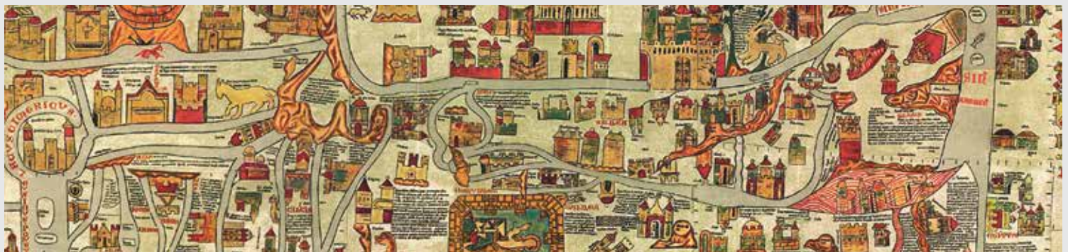
Élément de la carte d'Ebtorf, mappa mundi réalisée autour de 1300.

Quels sont les rapports entre la géographie, le mythe, le conte et l'archétype? La question sera débattue lors du 3 e colloque international de géographie humaniste qui se tiendra à Uni Mail le samedi 23 novembre. Pour ce faire, la petite dizaine d'intervenants invités s'appuieront sur des notions théoriques et questionneront les langages géographique, historique et