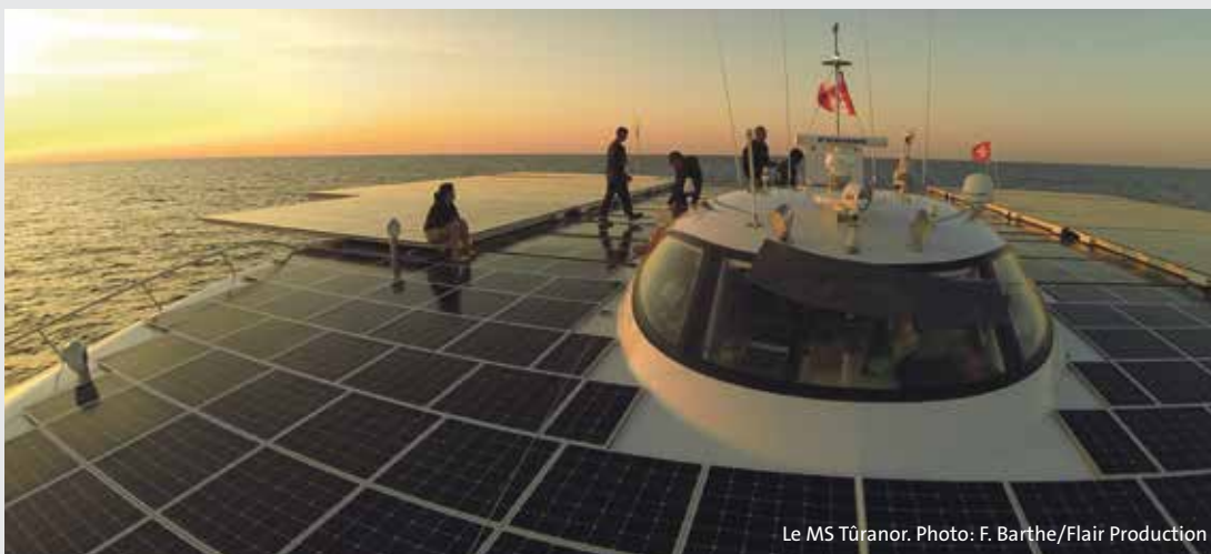
Le MS Tûranor.

Laurent Bignolas, journaliste et animateur français, a profité d'une escale à Halifax au Canada pour embarquer sur le MS Tûranor , le plus grand catamaran solaire jamais construit. Durant une dizaine de jours, le journaliste a vécu aux côtés de l'équipage, des chercheurs de l'UNIGE ainsi que le capitaine Gérard d'Aboville, partis en expédition scientifique le long du Gulf Stream. De cette expérience, il a tiré un documentaire, Opération SOLAR , qui sera projeté en avant-première le 26 novembre à Genève.