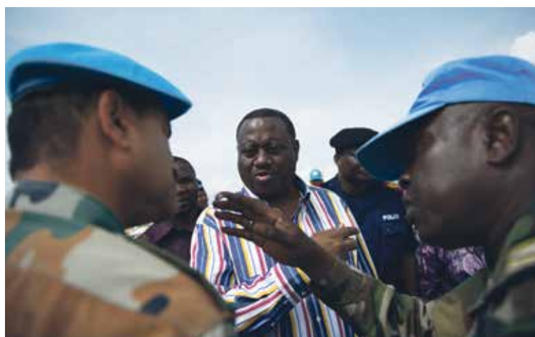
Un interprète (à droite) durant une discussion entre un ministre de la République démocratique du Congo et un représentant de l'ONU, en 2002.

Barbara Moser-Mercer: Cet «InZone@UNIGE Learning Hub» est la première unité légère adaptée à la formation d'interprètes en zones fragiles. Cette unité est bien davantage que le container dont elle a l'air à première vue. A l'intérieur, dix apprenants peuvent prendre place et disposent d'un poste de travail doté d'un écran, utile aussi bien pour l'enseignement présentiel qu'à distance. Le seul ordinateur présent, qui fait office de serveur, a lui-même été conçu spécialement pour les pays en voie de développement et ne contient aucune pièce mobile susceptible de casser. Le laboratoire utilise en outre