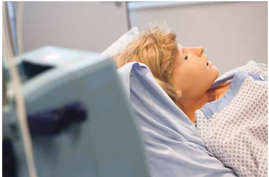
Mannequin du Centre interprofessionnel de simulation.