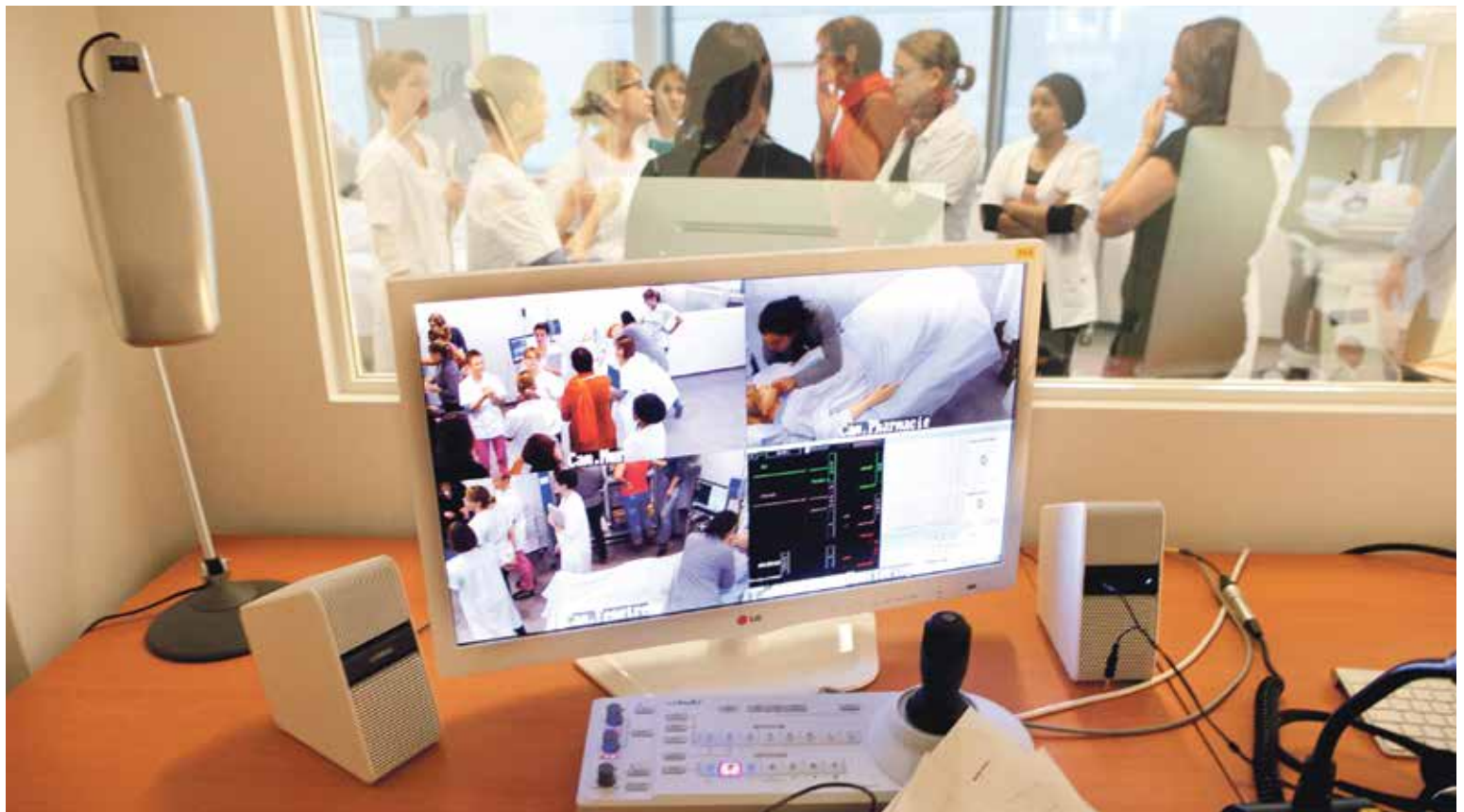
Vue de la salle de contrôle du Centre interprofessionnel de simulation durant une formation.