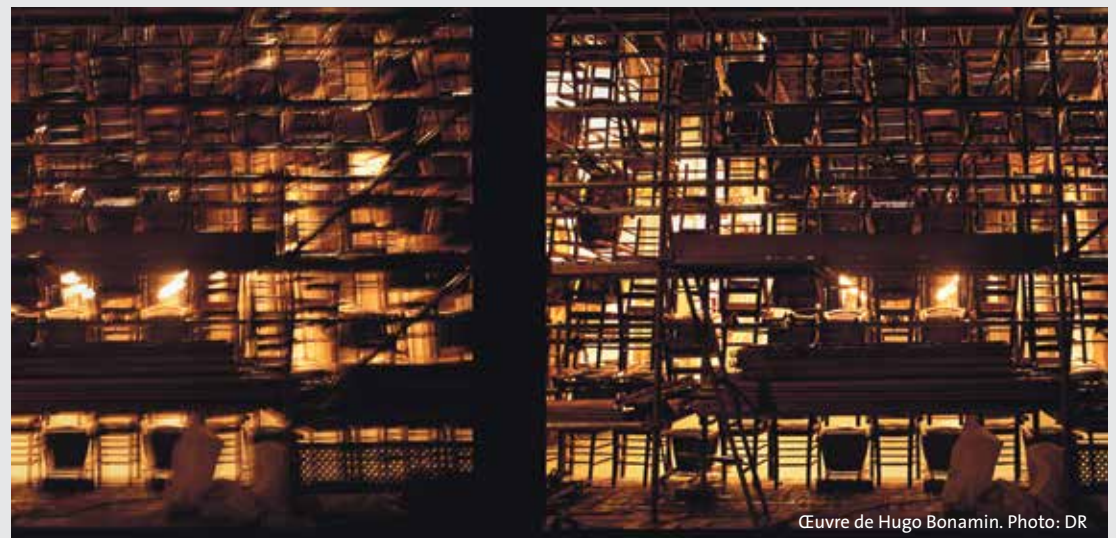
Cœuvre de Hugo Bonamin.

http://lemanicworkshop.wix.com/schizotypy