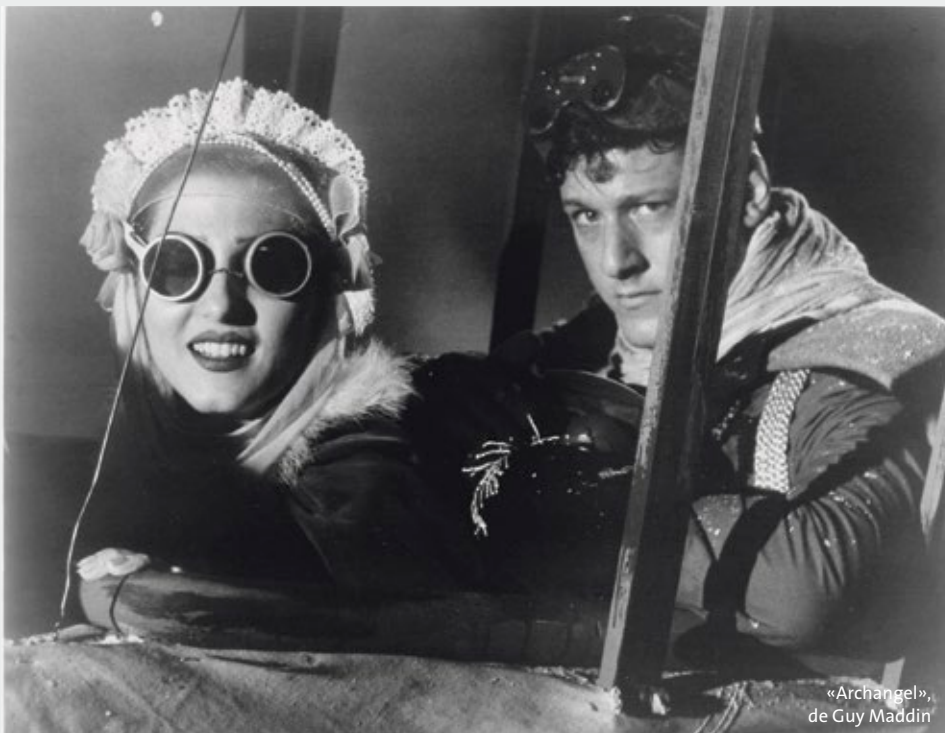
«Archangel», de Guy Maddin

Le cinéaste canadien Guy Maddin est un des grands réalisateurs contemporains. Son œuvre, d'une originalité et d'une force rares dans le cinéma actuel, se nourrit de sa passion pour le cinéma muet, dont il s'inspire librement pour construire des fictions surprenantes et hypnotiques. Le prochain cycle du ciné-club universitaire invite à découvrir l'œuvre de Guy Maddin, mais est également un parcours singulier au travers de l'histoire du cinéma avec la projection de quelques-uns des films favoris de Maddin, qui donnent une place essentielle au cinéma muet.