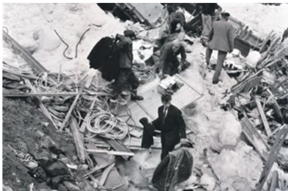
Les ruines du chantier, le lendemain de l'avalanche.