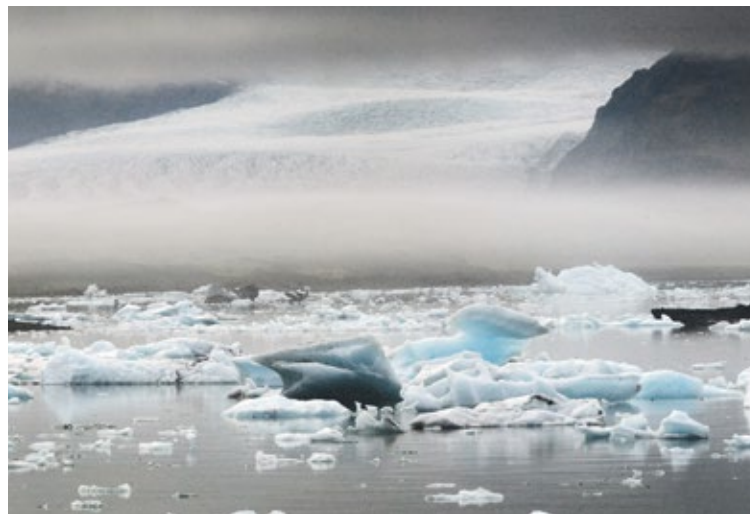
Glacier Vatnajökull en Islande.

Martin Beniston: Les attentes sont à la taille des enjeux et de leur urgence. S'il est vrai que Copenhague demeure un échec, malgré quelques avancées sur des points techniques, bien des choses ont changé depuis. Alors que cette conférence suivait la logique qui prévaut depuis le Protocole de Kyoto, à savoir définir un accord et une stratégie globale imposée par en haut, Paris 2015 tente une autre approche, par le bas cette fois. Chaque nation y présentera en effet les mesures individuelles qu'elle entend adopter pour maintenir le réchauffement mondial en deçà de 2 °C. L'objectif demeure le même, mais les pays pourront adopter des mesures correspondant mieux à leurs réalités politique, économique, sociale et culturelle. Cette prise en compte de la diversité est essentielle: les États-Unis prônent par exemple des mesures volontaires et sont rebués par les mesures autoritaires, ce