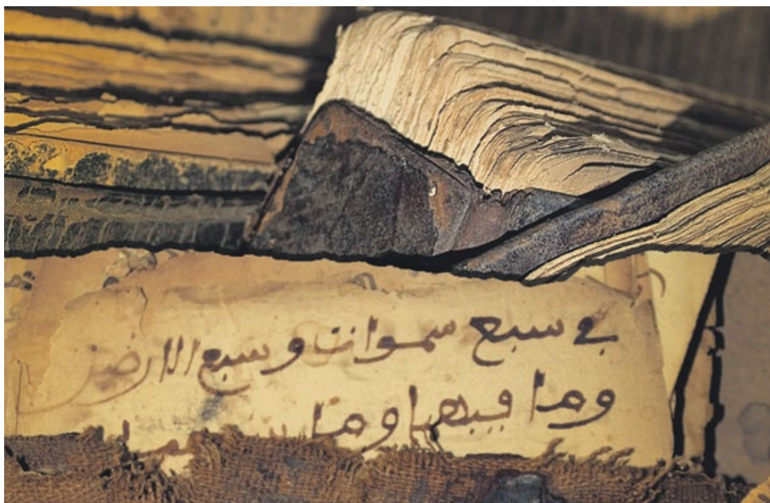
Manuscrits de Tombouctou.

n° 111 | du 19 novembre au 3 décembre 2015 | paraît le jeudi