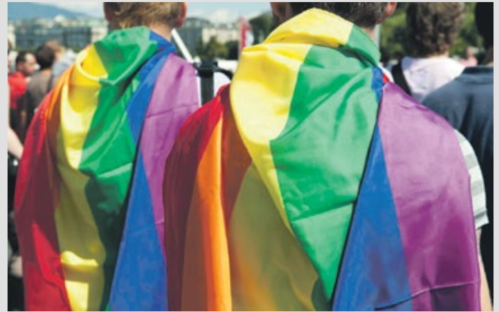
Gay Pride à Genève.

La protection des droits humains des personnes lesbiennes, gays, bisexuelles, transgenres et intersexuées (LGBTI) continue à faire face à d'importants défis. A l'occasion d'une réunion conjointe du Réseau européen des points focaux LGBTI gouvernementaux et du Réseau des Rainbow Cities le 20 novembre à Genève, le Service des relations internationales de l'UNIGE – en partenariat avec la Ville de Genève et le Département fédéral des affaires étrangères – organise une discussion publique réunissant des personnalités impliquées dans ce domaine au niveau local ou international.