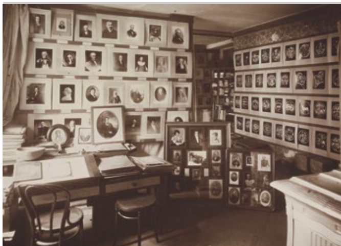
COLLECTION ICONOGRAPHIQUE VAUDOISE

Musée historiographique, Lausanne, avant 1914