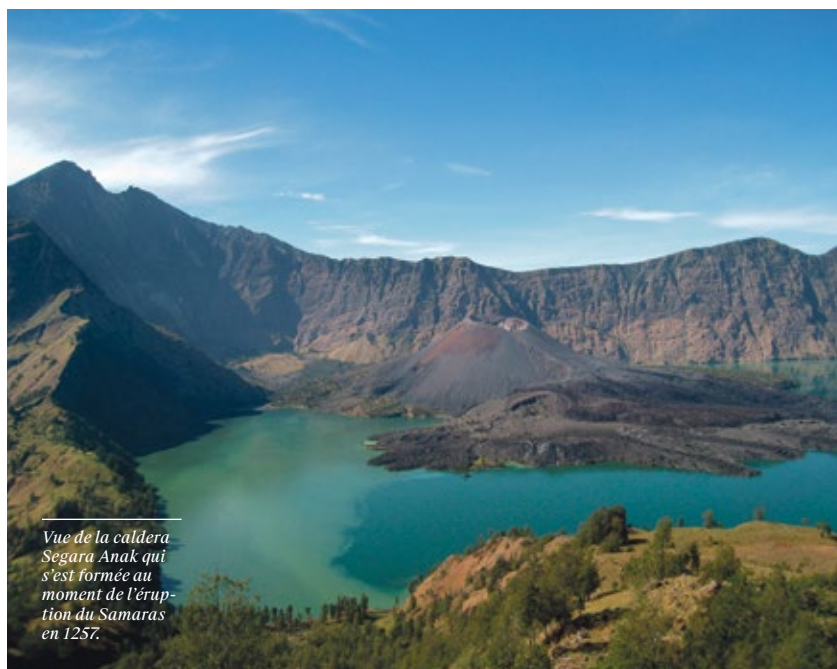
Vue de la caldera Segara Anak qui s'est formée au moment de l'éruption du Samalás en 1257.

L'éruption de 1257 a d'abord été identifiée grâce à des dépôts de cendre retrouvés dans les glaces du Groenland. Ce n'est qu'en 2013 qu'une équipe internationale a pu déterminer, sur la base de données géologiques, de datation au carbone 14 et de chroniques médiévales, que la source de cette éruption est le volcan Samalás, situé sur l'île Lombok en Indonésie. –