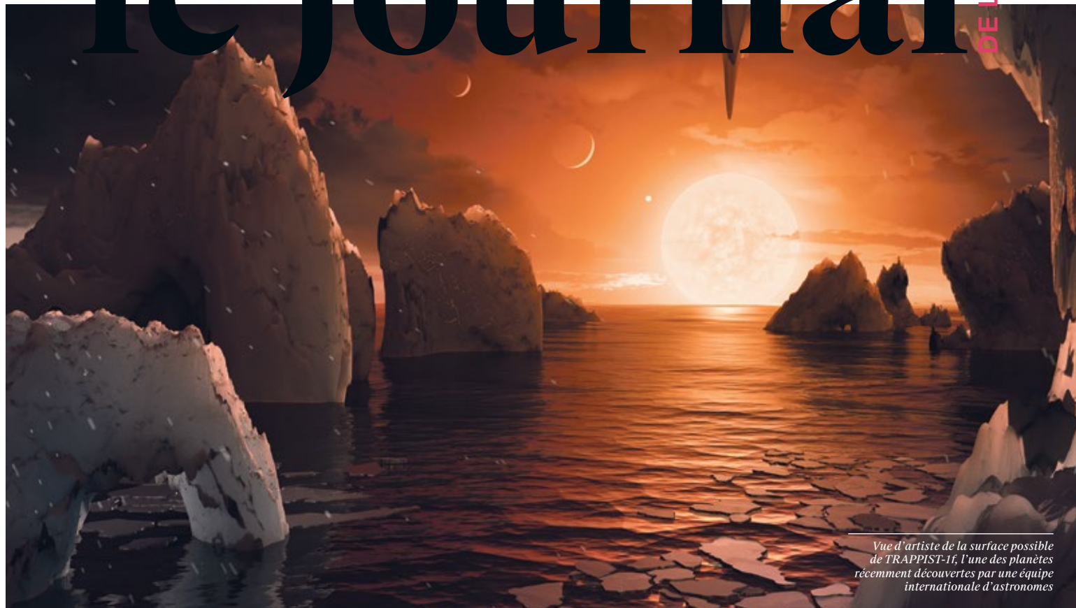
Vue d'artiste de la surface possible de TRAPPIST-1f, l'une des planètes récemment découvertes par une équipe internationale d'astronomes