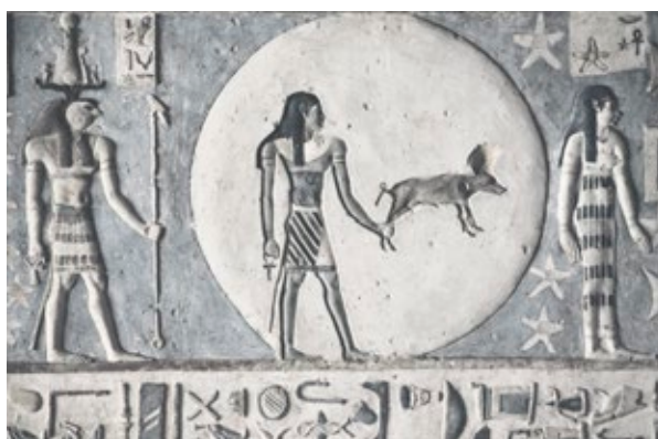
Plafond du temple de Dendera (détail)

D'une part, la consommation du porc sur les rives du Nil