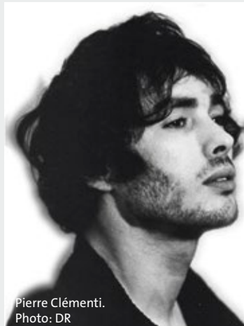
Pierre Clémenti.

Figure indomptable du cinéma européen des années 1960 et 1970, Pierre Clémenti n'appartient à aucune famille de comédiens: capable de faire vibrer un plan par sa seule présence, il a mis son magnétisme au service d'auteurs fuyant les compromissions du cinéma commercial. Outre ses interprétations les plus marquantes, ce cycle permettra de découvrir pour la première fois en Suisse l'intégralité de son œuvre de cinéaste.