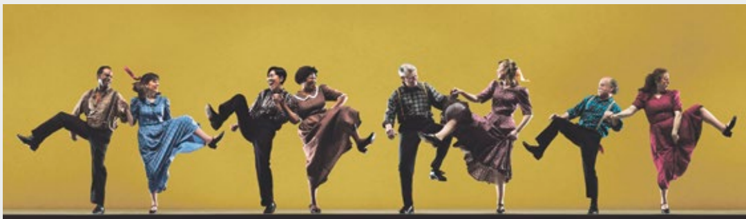
Danses appalaches.

Uni Mail, Salle MR290 www.unige.ch/ethique-transversale/printemps2014.html Sarah.Nicolet@unige.ch