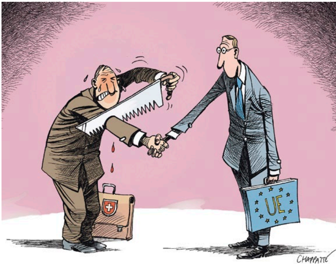
Illustration: Chappatte dans «Le Temps», Genève, www.globecartoon.com

DES ÉVÉNEMENTS DE L'UNIGE n° 88 | du 27 mars au 10 avril 2014 | paraît le jeudi