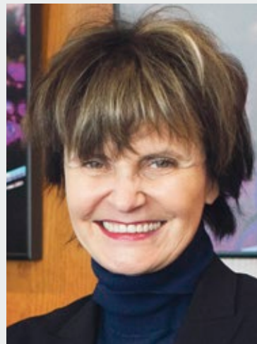
Micheline Calmy-Rey.

L'ancienne conseillère fédérale (cheffe du Département des affaires étrangères de 2003 à 2011) démontre dans son livre que la Suisse a un rôle essentiel à jouer sur la scène internationale malgré sa discrétion et sa petite taille. Evoquant son expérience, ses convictions politiques ainsi que les nombreux souvenirs qu'elle garde de son mandat au Conseil fédéral, elle revient dans son ouvrage, notamment, sur la crise libyenne, sur le rôle de médiateur de la Genevoise lors du différend nucléaire avec l'Iran, ainsi que sur ses nombreux tête-à-tête avec des chefs d'Etat. La conférence-débat sera suivie d'une séance de dédicaces.