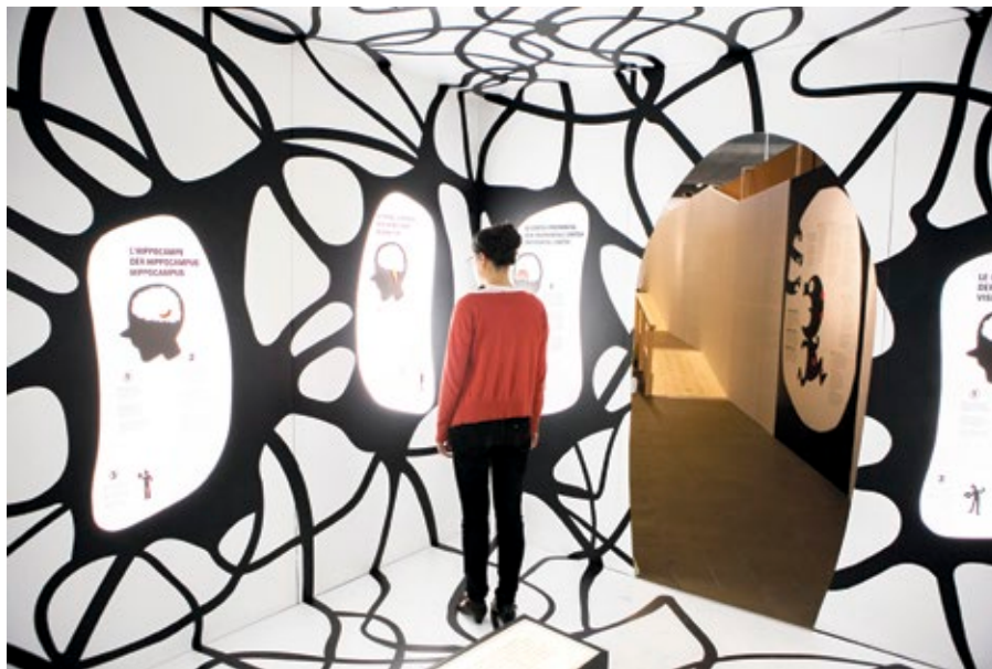
Exposition «Pas de panique!».

Réalisée par l'UNIGE en collaboration avec de nombreuses autres institutions scientifiques et académiques, Pas de panique! fait la part belle aux installations interactives que le public est invité à tester de manière plus ou moins guidée. L'exposition est en effet conçue comme un parcours découverte au cours duquel le visiteur part des bases neurologiques de la peur pour aborder ensuite les mécanismes qui concourent à ses manifestations physiologiques, comme la chair de poule, par exemple.